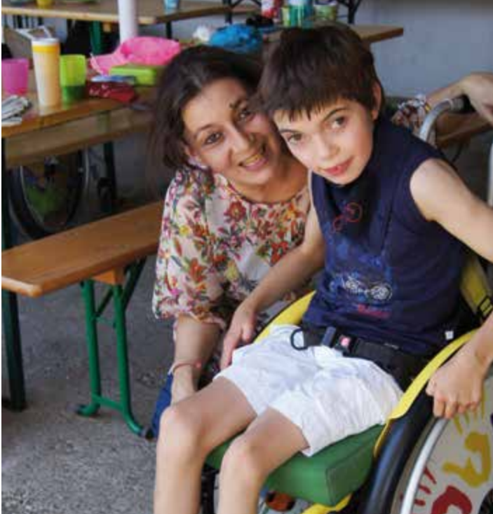
Gemeinsam feiern auf Gut Hausen.