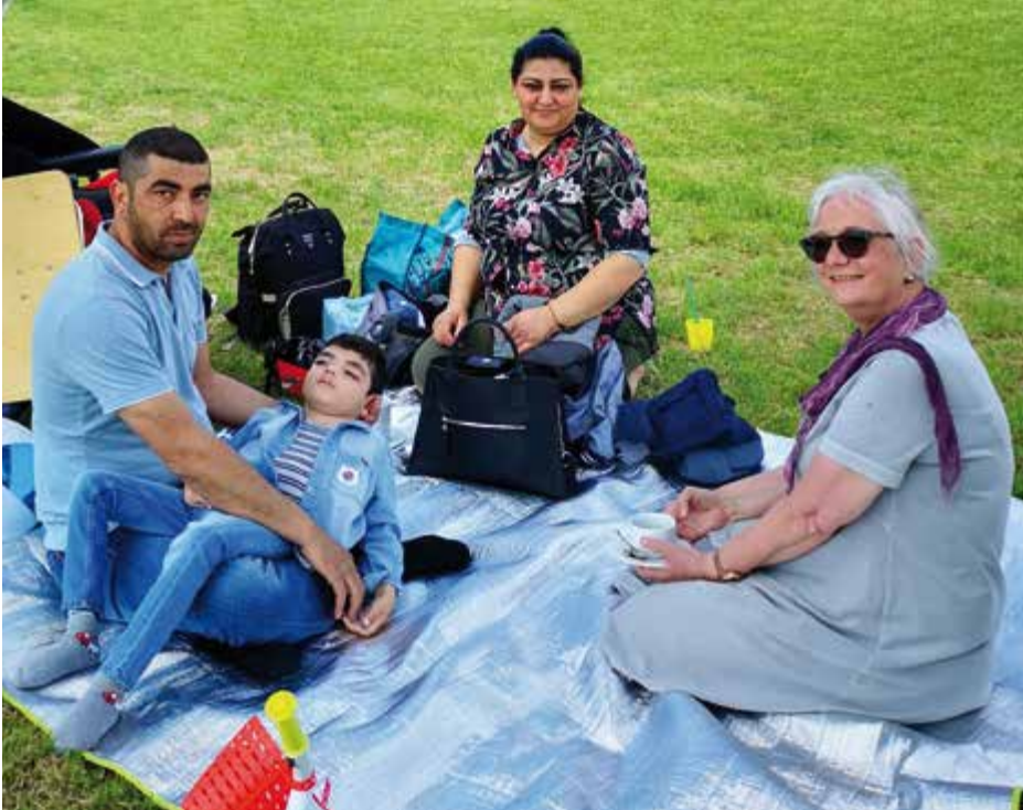
Zusammen sitzen und Kontakte knüpfen – das ist auf Gut Hausen ungezwungen möglich.