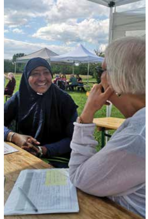
Erfahrungsaustausch und Beratung bei unseren Treffen.