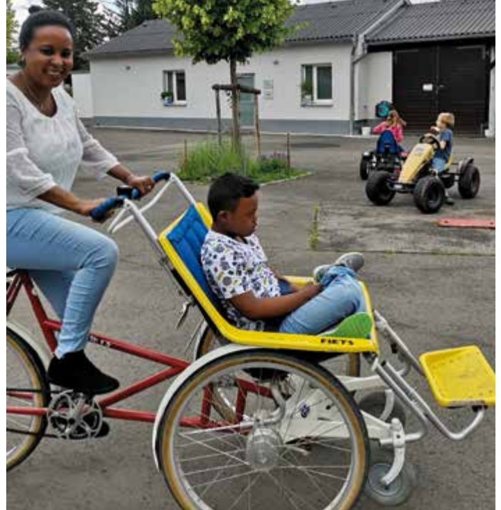
Der Innenhof auf Gut Hausen lädt zum Radfahren ein.