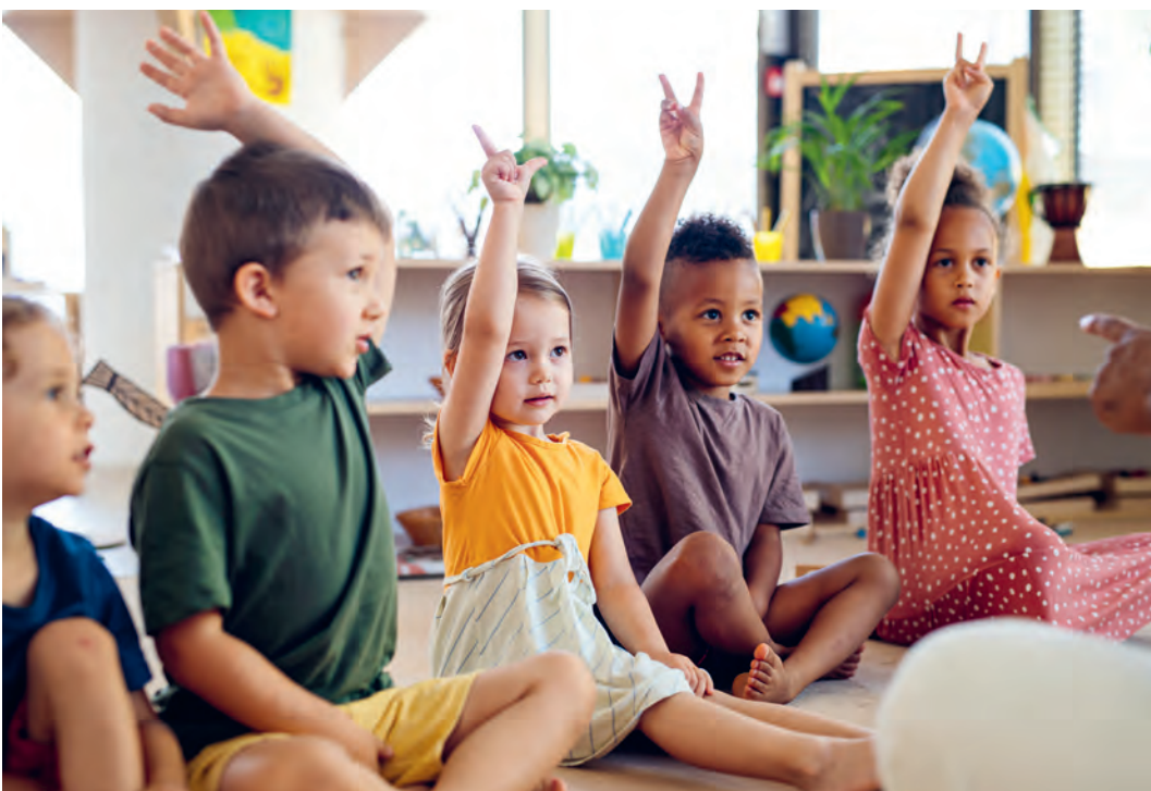
Abbildung: Hör mal! Eine pädagogische Fachkraft hat für die Kinder ein Hör-Quiz aufgenommen. Welche Geräusche sind das?

Folgen Sie dem QR-Code, um die Geräusche zu hören.