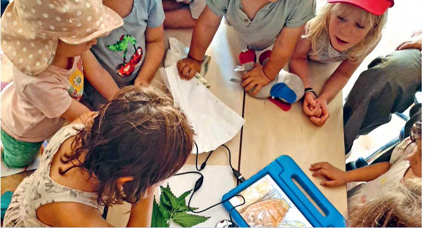
Abbildung: Wir sind große Naturforscher und nehmen alles unter die Lupe!