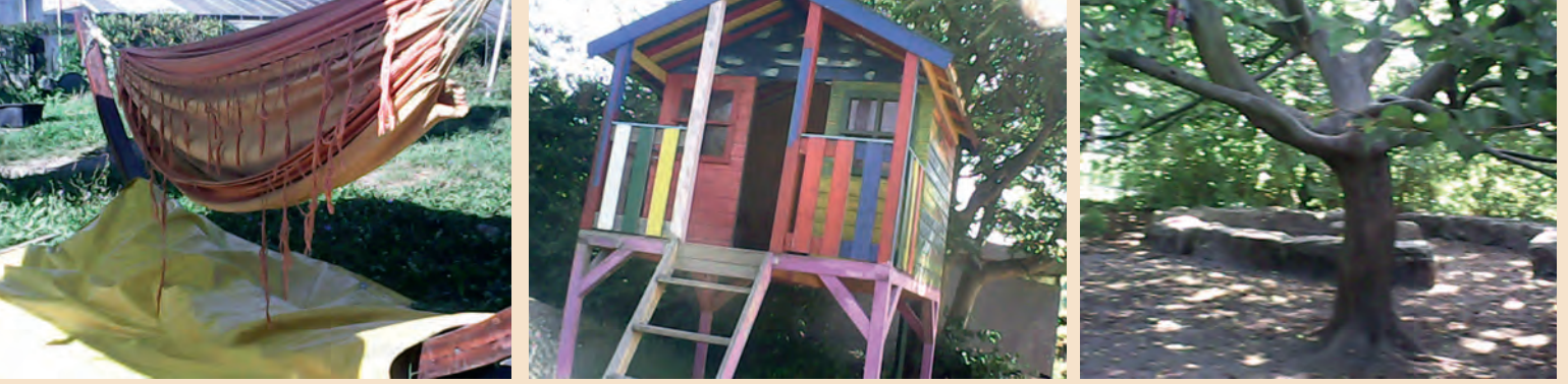
Abbildung 1-3: Die Kinder aus dem Naturkindergarten fotografieren selbständig mit Kinder-Kameras ihre Lieblingsplätze und sprechen danach darüber.