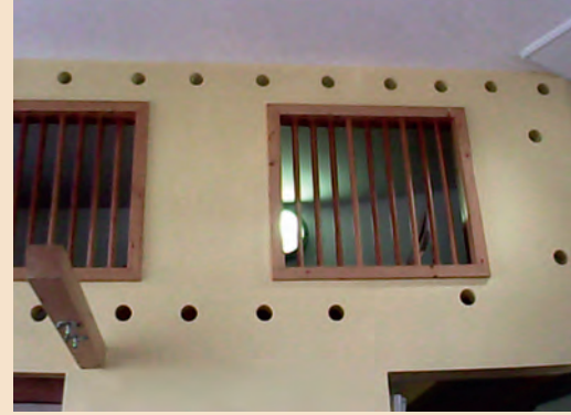
Abbildung 1-3: Die Kinder fotografieren selbständig mit Kinder-Kameras Orte, an denen sie sich nicht so wohl fühlen. Danach sprechen wir gemeinsam darüber und können die Einrichtung noch schöner für die Kinder gestalten.