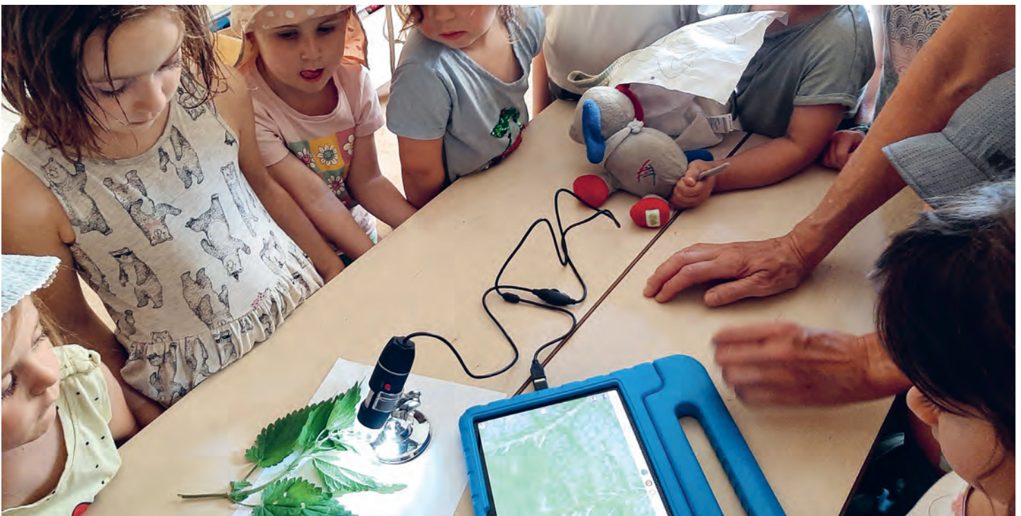
Abbildung 1-4: Eine digitale Lupe lässt sich an das Tablet anschließen. So können wir uns unsere Funde aus der Natur ganz genau ansehen!

Bei Geräten, die gezielt zur Unterstützten Kommunikation verwendet werden (wie z. B. Talker, Tablet oder Step-by-Step), gelten individuelle, miteinander abgesprochene Regeln. Siehe dazu auch unser Konzept zur Unterstützten Kommunikation.