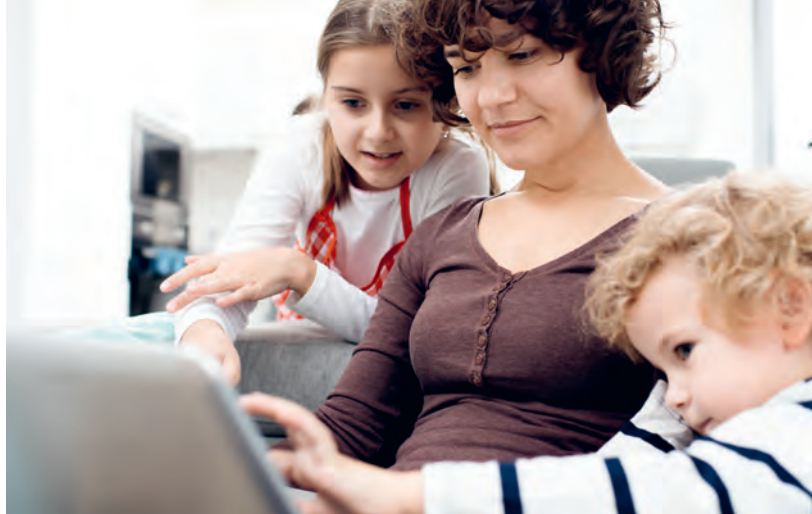
Abbildung: Wer findet als erstes die Lösung für das Bilderrätsel?

Im Rahmen dieses Konzeptes begegneten uns viele Informationen für Eltern zum Thema Medienpädagogik. Einige davon führen wir hier auf: