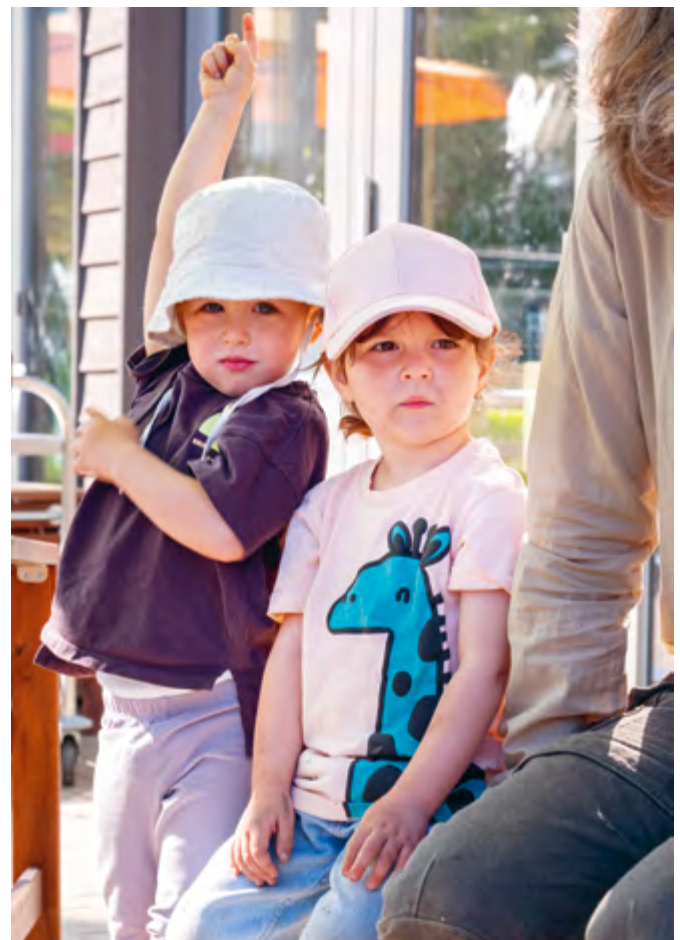
Abbildung 13: Beteiligung durch Fragen, Zuhören und nach Antworten suchen.

Diese wertebasierte Erziehung bildet in den Kindern auch die Grundlage für ein Demokratieverständnis. Denn die Kinder lernen, Verantwortung für ihr Handeln zu übernehmen und sich zu beteiligen.