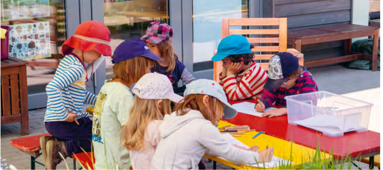
Abbildung 7: Auch unsere Kreativangebote finden draußen statt.