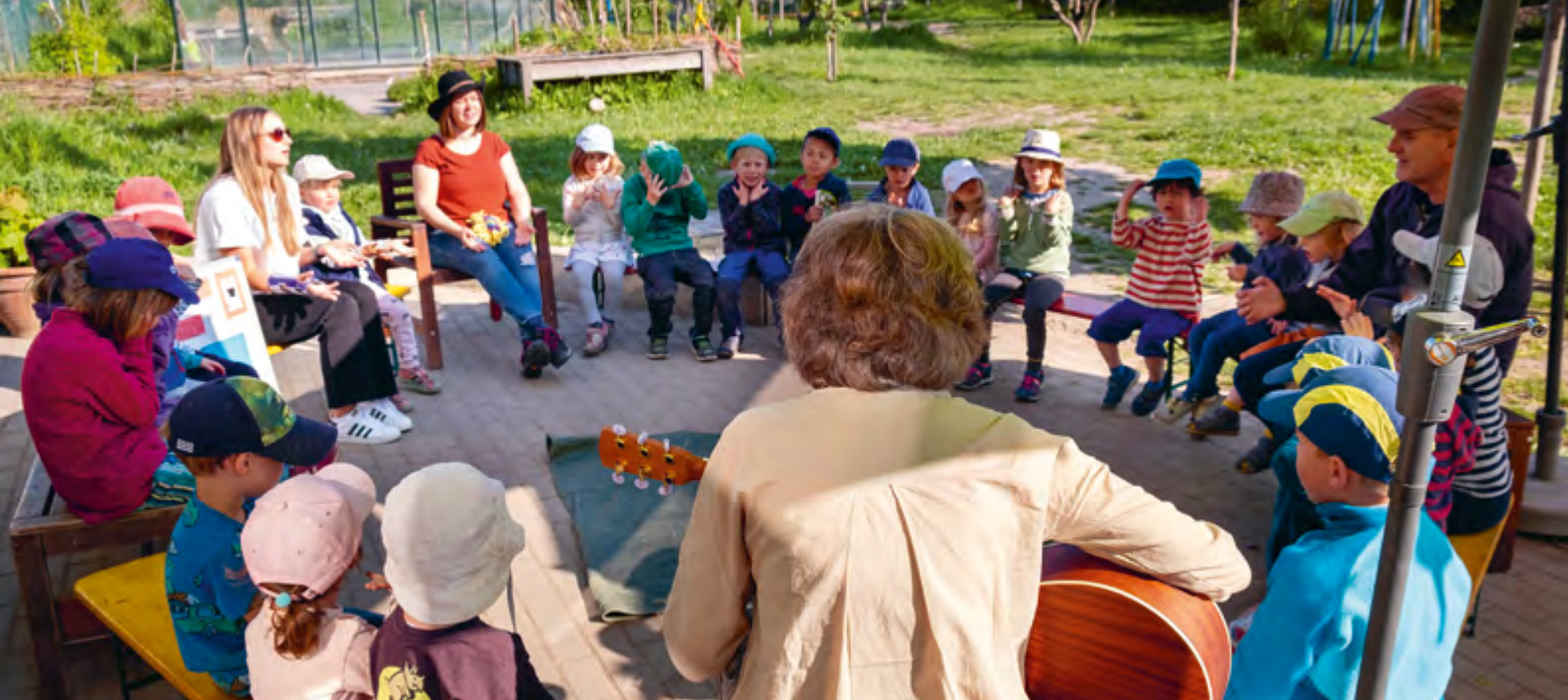
Abbildung 23: Musik und Gesang begleiten uns in unserer täglichen Arbeit.