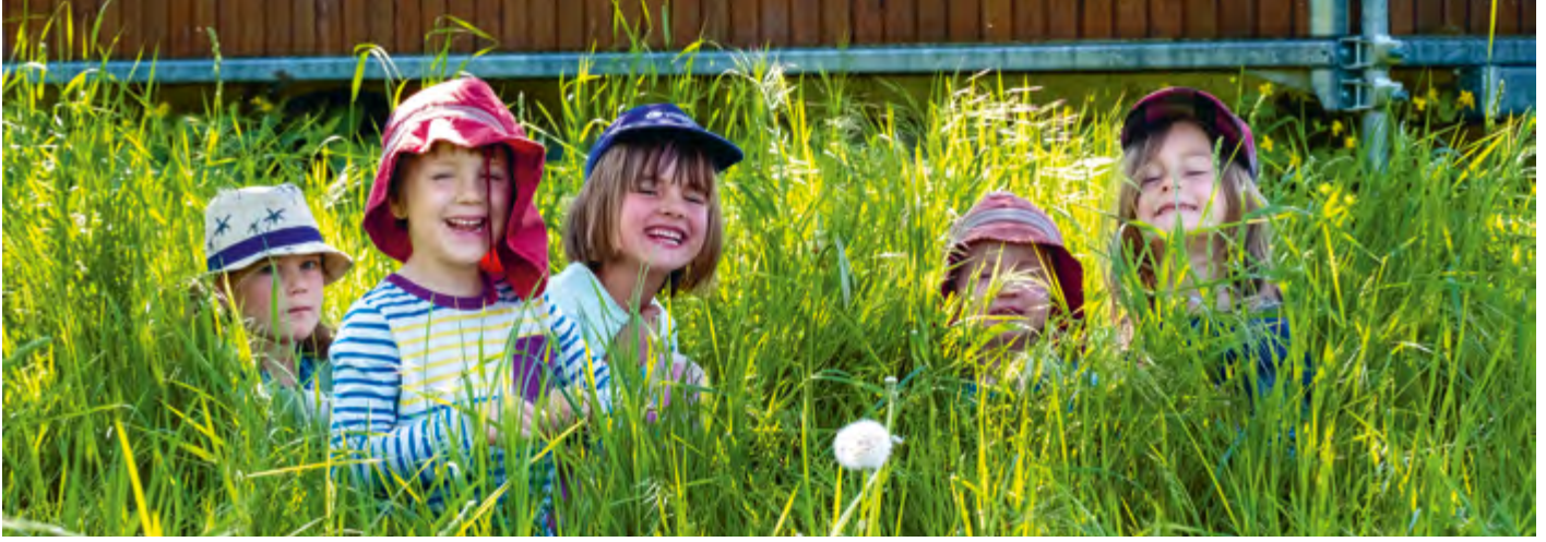
Abbildung 35: Zeit, gemeinsam fröhlich zu sein.