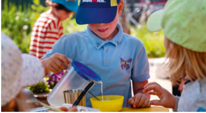
Abbildung 24: Unser offenes Frühstück findet meistens draußen statt.