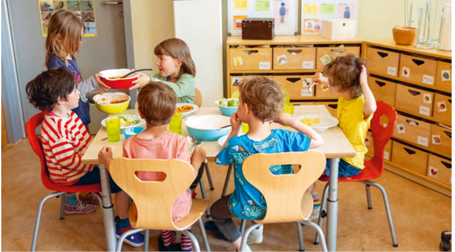
Abbildung 42: Die Kinder wechseln sich beim Tischdienst ab – so sieht Kooperation aus.