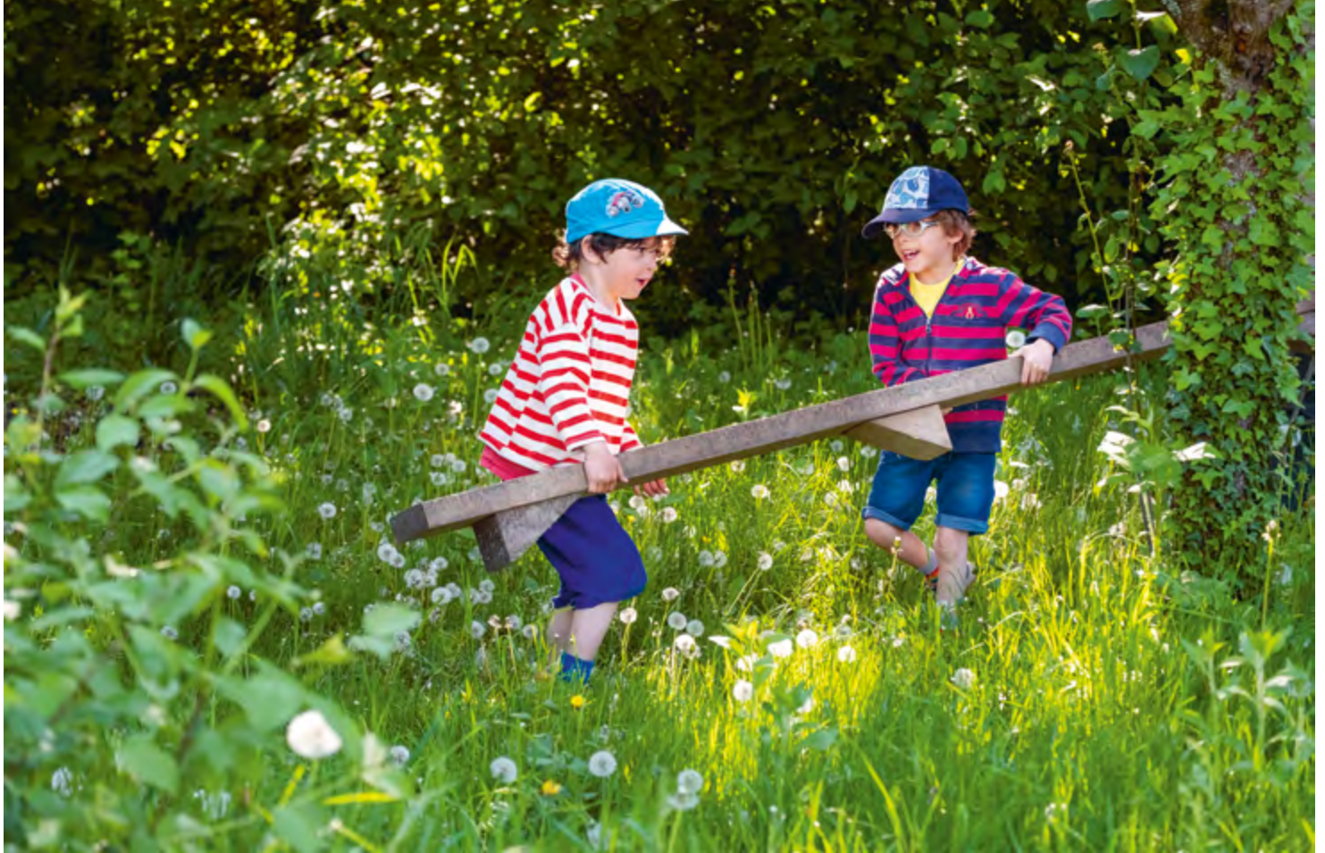
Abbildung 4: Zusammen sind wir stark!