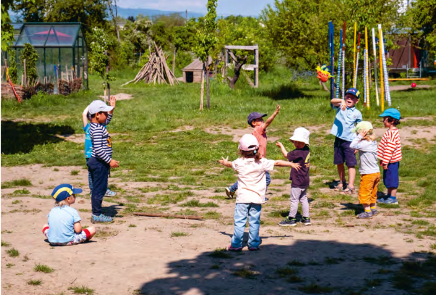
Abbildung 12: Die Kinder sind ganz individuell und gleichzeitig Teil unserer Gemeinschaft.