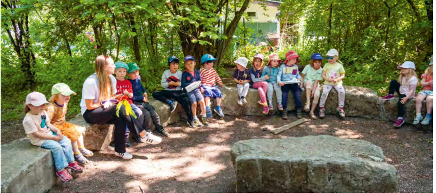
Abbildung 6: Im Alltag nutzen wir Lautsprachunterstützende Gebärden.