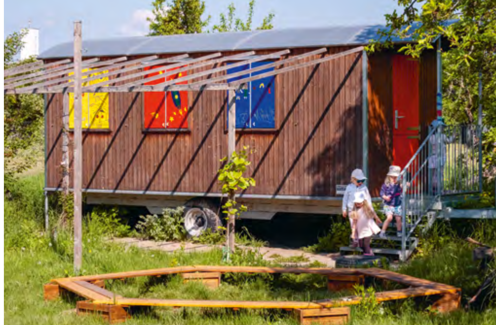
Abbildung 28+29: Der Bauwagen auf unserem Gelände dient als Rückzugsort für kleinere Spielgruppen.