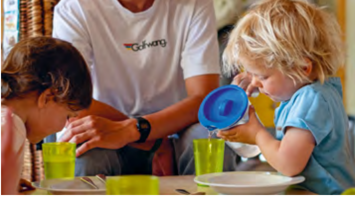
Abbildung 17: Wir helfen den Kindern auf ihrem Weg zur Selbständigkeit.