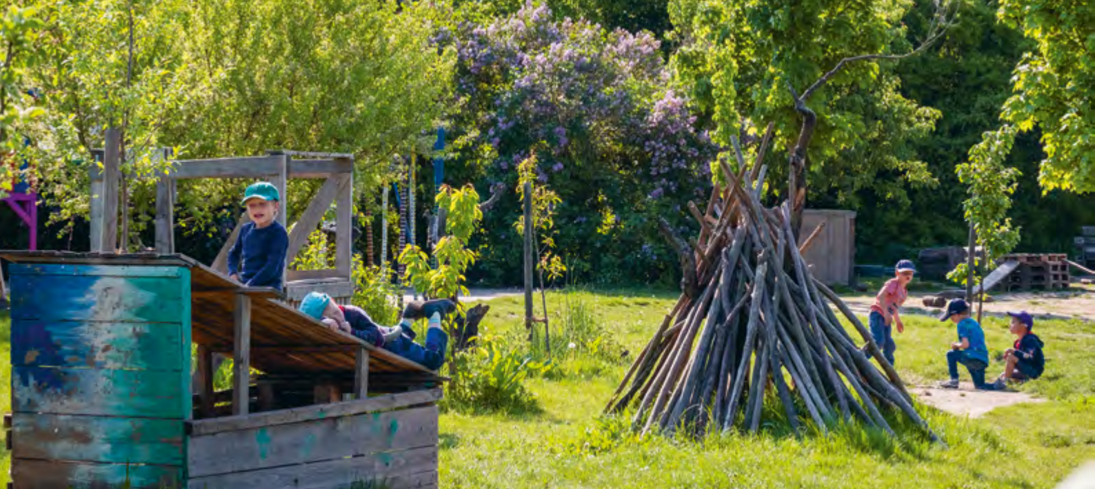
Abbildung 22: Unser weitläufiges Außengelände lädt zum freien Spielen ein.