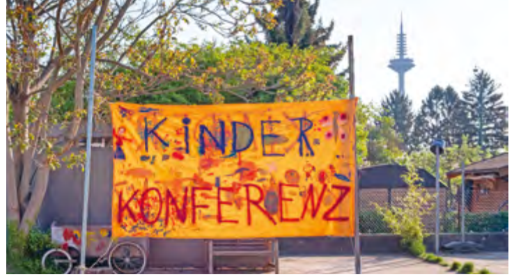
Abbildung 20: Für alle gut sichtbar: Heute findet unsere Kinderkonferenz statt.