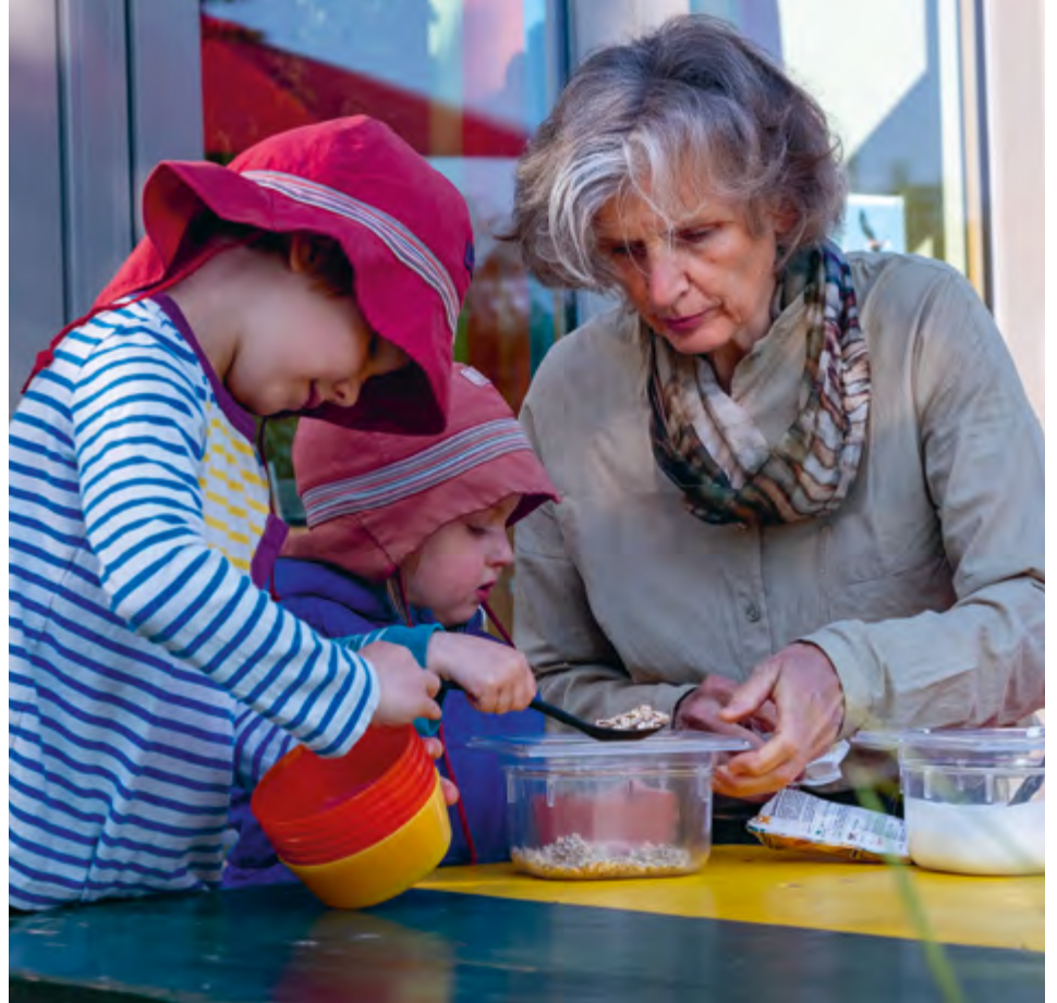
Abbildung 38+39: „Ich kann das schon alleine.“