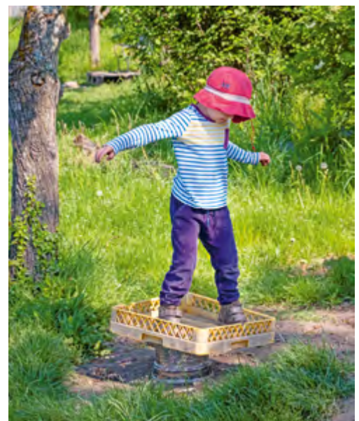
Abbildung 10: Wie lange kann ich die Balance halten?