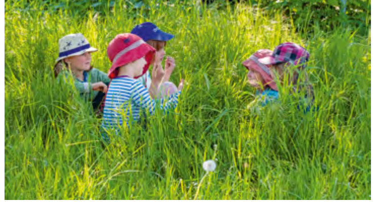
Abbildung 25: Blumen und Gräser laden zum Verweilen und Entspannen ein.

einem geschützten Rahmen Erfahrungen mit den Hunden zu sammeln. In Kleingruppen wird sich mit dem Wesen, Verhalten und den Charakteren der Hunde spielerisch beschäftigt.