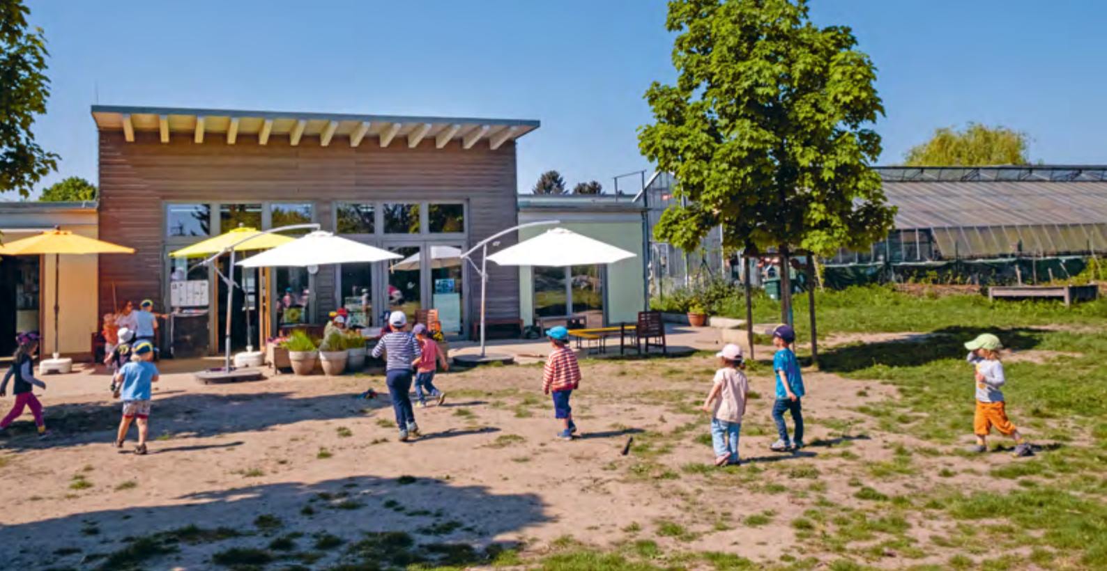
Abbildung 41: Unsere Bäume und Schirme spenden uns im Sommer Schatten.