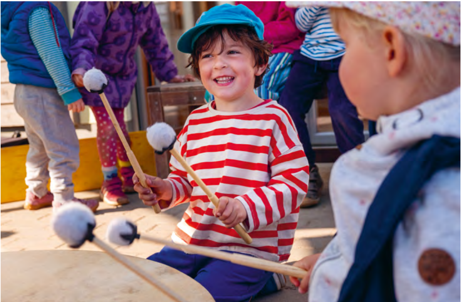
Abbildung 32: Musizieren macht allen Kindern große Freude.