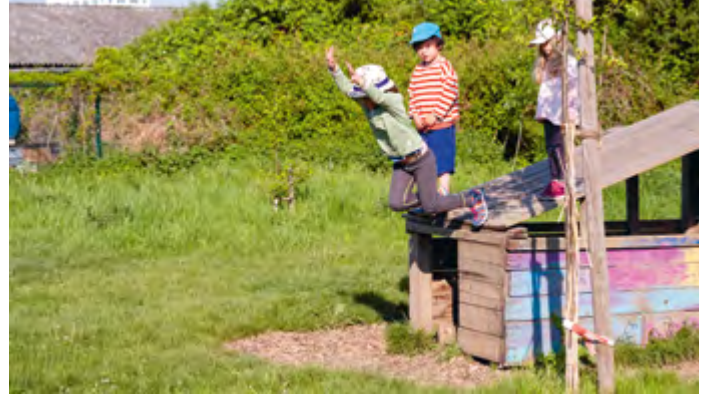
Abbildung 18: Bereit zum Absprung – unsere Abschlussgruppe.