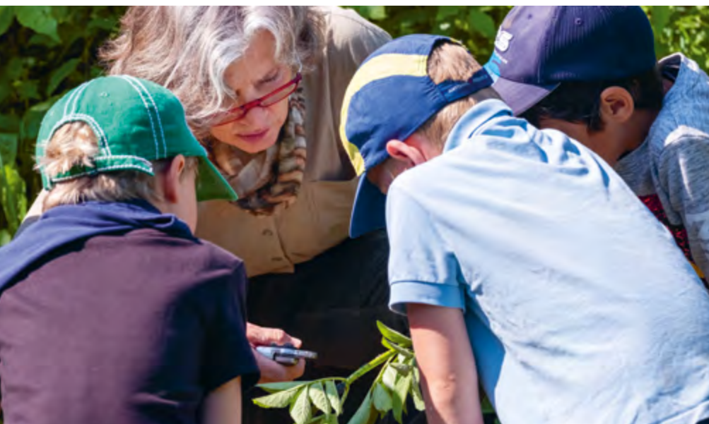
Abbildung 9: Wir unterstützen den Entdeckungsdrang der Kinder.

Wir ermöglichen unseren „forschenden“ Kindern Zugang zu verschiedenen Materialien, damit sie je nach Interesse und Wissensstand selbstbestimmt Erfahrungen sammeln können. So können sie bereits im Vorschulalter die ersten Wenn-Dann-Beziehungen herstellen und sind damit gut für den Übergang in Kindergarten und Schule vorbereitet