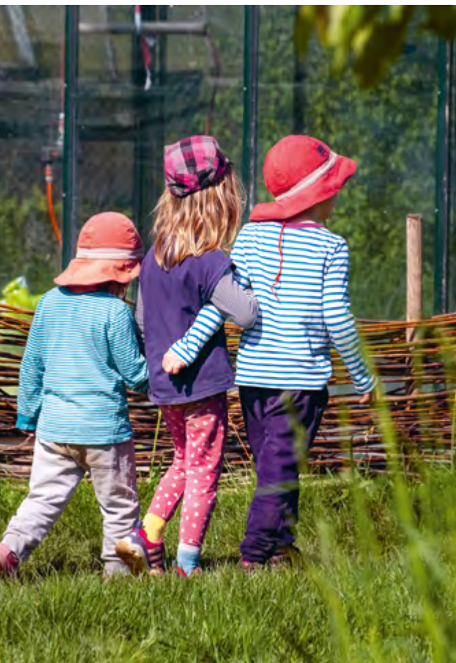
Abbildung 30: Rollenspiele entstehen.