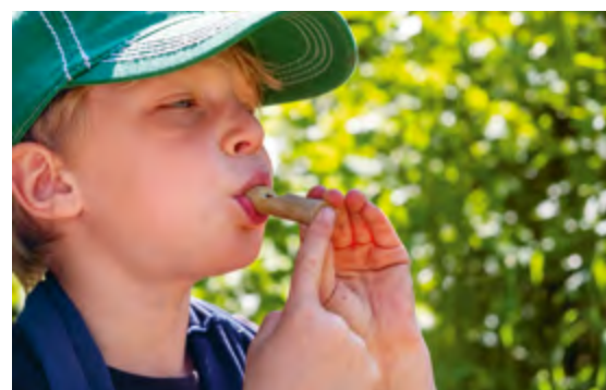
Abbildung 8: Die Natur wird mit allen Sinnen erkundet.

Gemeinsames Singen und Musizieren fördert nicht nur das soziale Lernen und die Kontaktfähigkeit, sondern wirkt sich zudem auch positiv auf die Sprachentwicklung der Kinder aus. Die kindliche Freude daran, Töne zu produzieren und zu entdecken, kann in gemeinsamen Musik- und Singkreisen gut aufgegriffen werden.