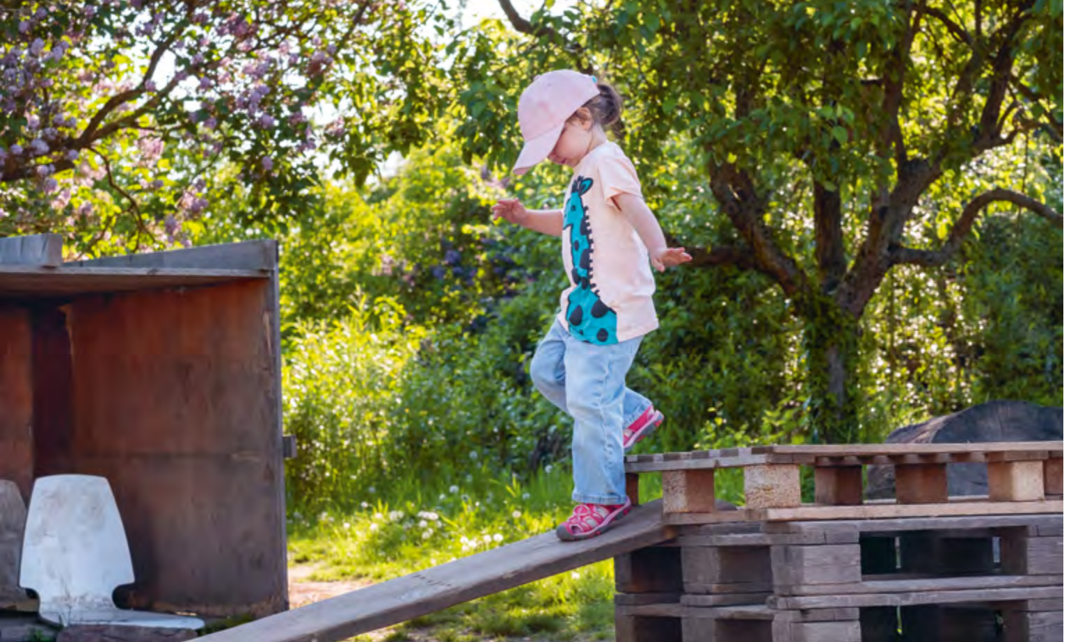
Abbildung 40: Ängste und Unsicherheiten überwinden.