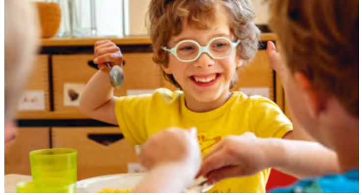
Abbildung 27: Auch während des Essens ist Zeit für Austausch und Gespräche.

Wochentag benannt, Tagesabläufe besprochen, Pläne geschmiedet, über Vorschläge abgestimmt, Lieder gesungen und Spiele gespielt. Die Kinder lernen, sich als Gruppe wahrzunehmen, konzentrieren sich und hören zu. Sie lernen, sich in einer Gruppe zu verhalten und zu artikulieren und bekommen ein Verständnis von Mengen, Zahlen, Zeit, Abläufen und demokratischen Strukturen. Aber auch die Motorik, kognitive, soziale und emotionale Bereiche werden hier angesprochen und gefördert. Einmal pro Woche findet anstelle der Morgenkreise eine gemeinsame Kinderkonferenz statt. Hier werden Themen und Anliegen der Kinder und Erwachsenen, wie zum Beispiel eine bevorstehende Aktion oder Regeln, besprochen. Die Kinder lernen hierbei, ihre Anliegen einzubringen, miteinander zu diskutieren und gemeinsame Lösungen in der Großgruppe zu entwickeln.