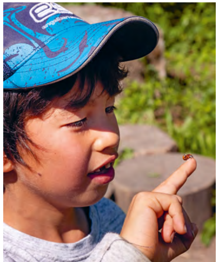
Abbildung 5: Beim Gärtnern nehmen wir Rücksicht auf alle Lebewesen.

Wir haben einen Bauerngarten, in dem wir Obst und Gemüse gemeinsam mit den Kindern anbauen und beim Wachsen zuschauen. Durch das Säen, Gießen und Pflegen der Pflanzen sowie dem Ernten und Weiterverarbeiten der angebauten Lebensmittel zu Marmeladen oder Suppen lernen die Kinder viel über gesunde Nahrungsmittel und Ernährung.