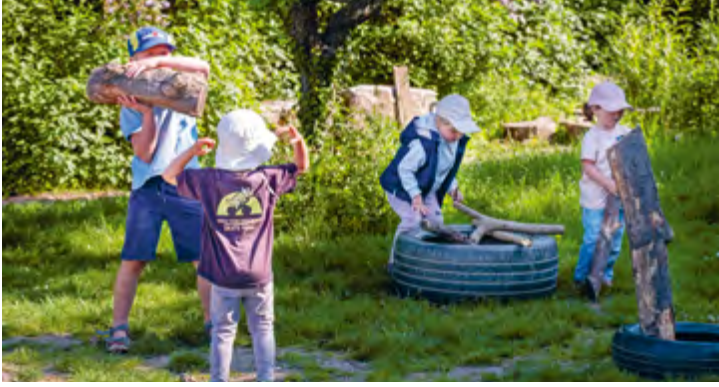
Abbildung 2+3: Jedes Kind trägt einen Teil zu unserer Gemeinschaft bei.