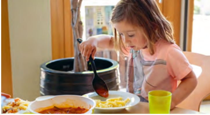
Abbildung 26: Die Kinder nehmen sich das Essen selbst.