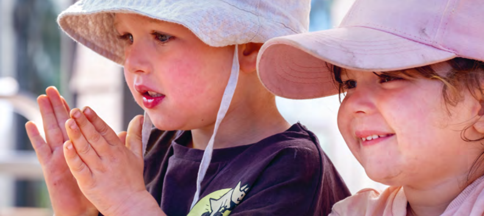
Abbildung 21: Jedes Kind wird in Entscheidungen miteinbezogen.

Dazu gibt es die Möglichkeit, regelmäßige Gespräche zu führen und gemeinsame Vereinbarungen zu treffen. Wir möchten die Eltern kennenlernen und ihnen die Möglichkeit geben, uns kennenzulernen. Wir legen Wert darauf, offen über unsere Arbeit zu berichten, z. B. durch Elterninformationen oder Pinnwände.