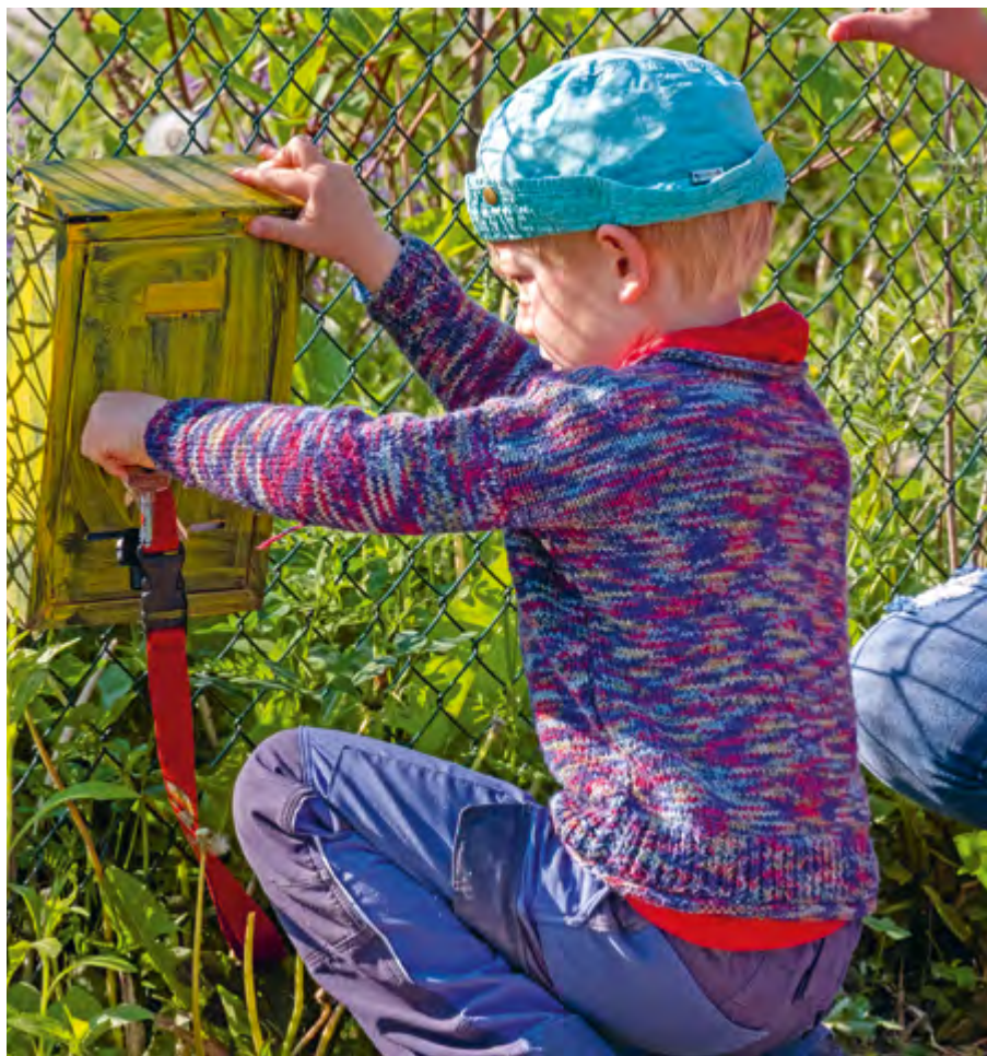
Abbildung 31: Haben wir einen Brief für die Kinderkonferenz?