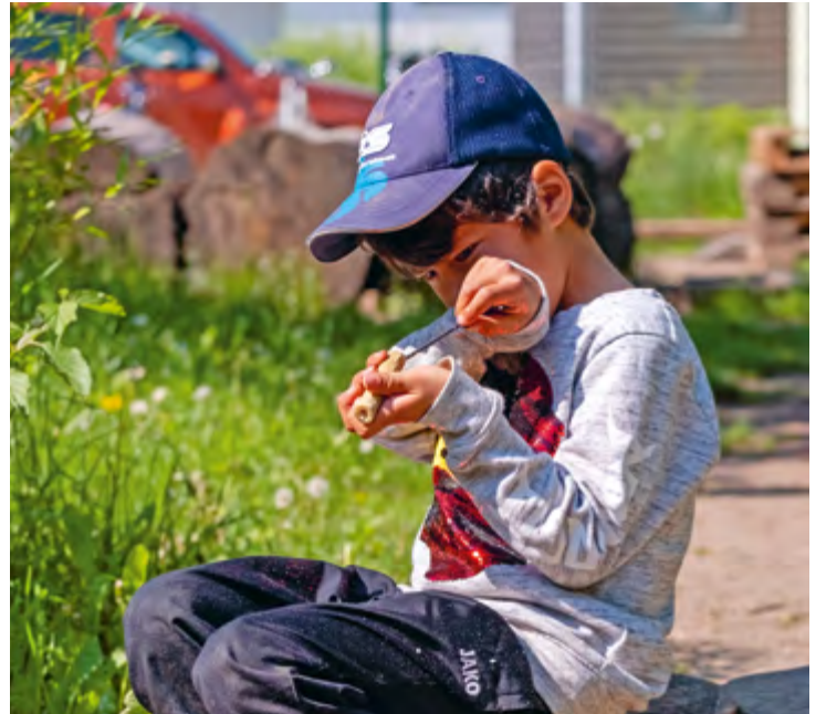
Abbildung 1: Die Natur inspiriert die Kinder dazu, Neues auszuprobieren.

Das Hochklettern auf unseren Kletterbaum ist für viele Kinder eine Herausforderung. Wir unterstützen die Kinder beim Ausprobieren, setzen sie aber nicht auf einen Ast. Die Kinder versuchen es dann so lange, bis sie es eigenständig geschafft haben. Wir begleiten sie dabei, indem wir sie anfeuern und anleiten.