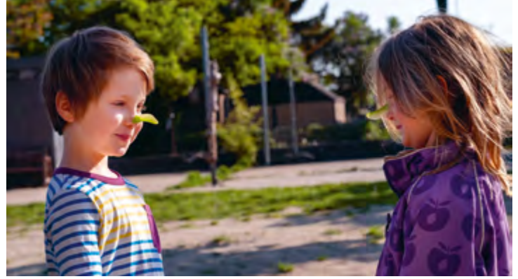
Abbildung 15+16: Kinder kommen im Freispiel auf die schönsten Ideen.

Darauf aufbauend sind die Kinder der Ausgangspunkt für die Bildung: Sie zeigen uns, für welche Themen sie sich interessieren. Kinder suchen nach neuen Erfahrungen und Erlebnissen. Darauf gehen wir ein.