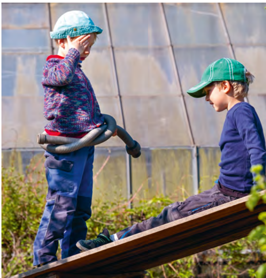
Abbildung 33+34: Bei uns können sich die Kinder vielfältig ausprobieren.