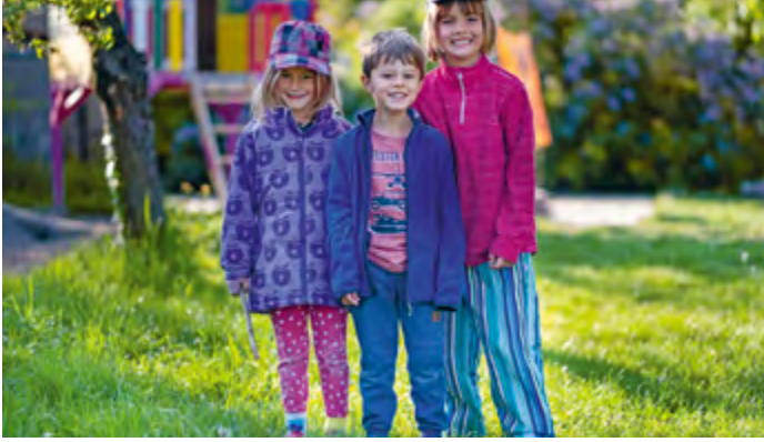
Abbildung 19: Die Kinder treffen im NAKI ihre Freunde und Freundinnen.