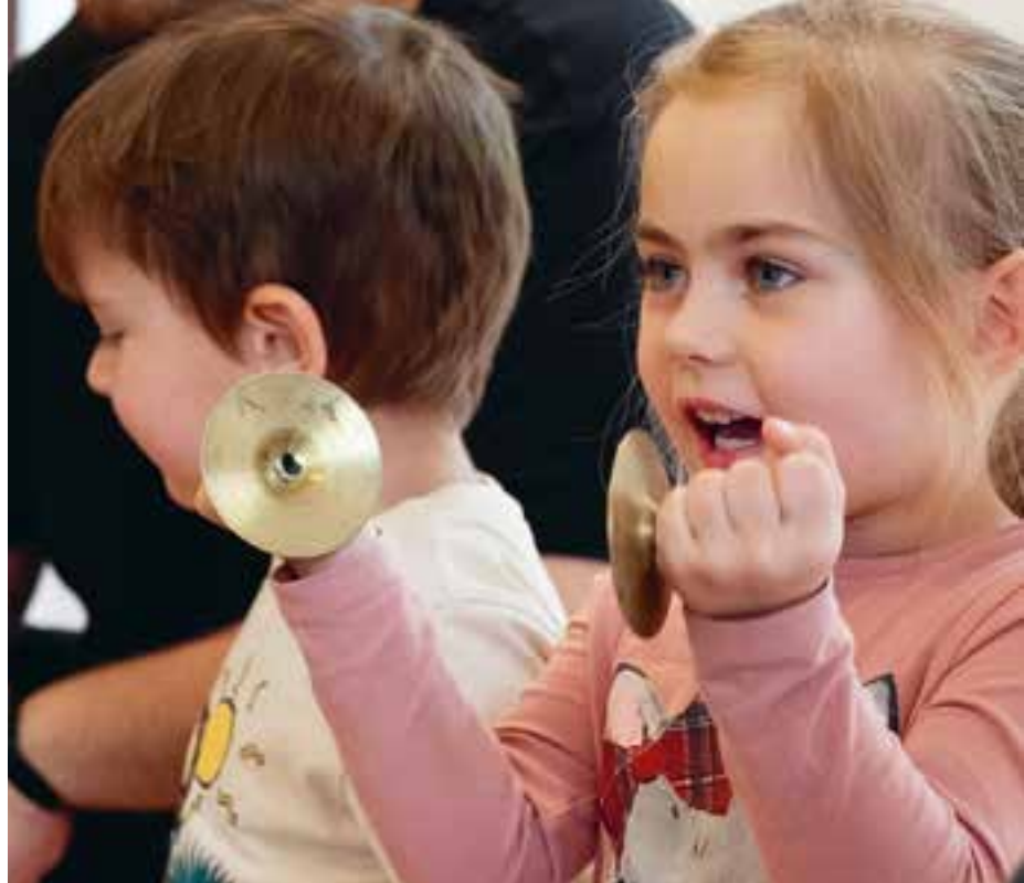
Abbildung 27: Heute singen wir laut und musizieren dazu!

fest, bei dem die Eltern und ehemalige Kinderladenkinder herzlich eingeladen sind. Im Herbst beginnt das große Laternenbasteln für unseren Laternenumzug im November. Zur Adventszeit besucht uns traditionell der Nikolaus und überrascht die Kinder mit kleinen Leckereien. Unser Jahresabschlussfest ist unsere Weihnachtsfeier, das wir gemütlich mit den Kindern und deren Familien verbringen.