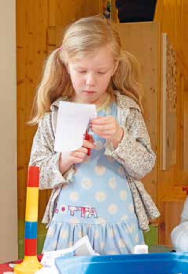
Abbildung 36: Der Maltisch lädt immer wieder ein, die Feinmotorik zu stärken.