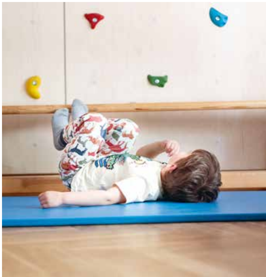
Abbildung 29: In der Ruhephase suchen die Kinder abwechselnd die Musik oder Geschichte aus.