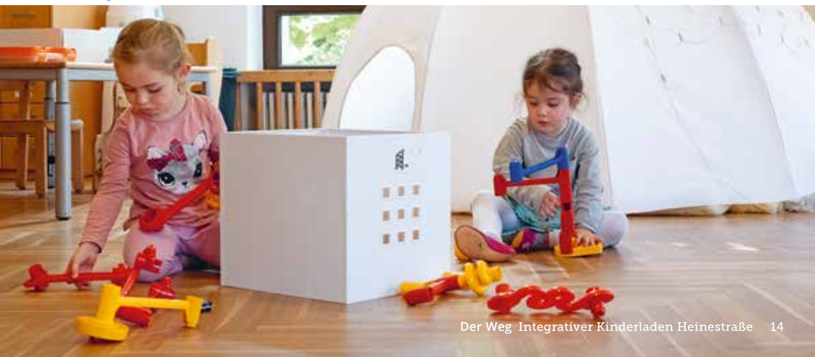
Abbildung 15: ...und hier bauen sich die Kinder ihre Bahn auf, um die Murmeln kullern zu lassen.

Wir leben einen geregelten Tagesablauf, bei dem die Kinder Stabilität erfahren und sich so auf neue Bildungsprozesse gut einlassen können.