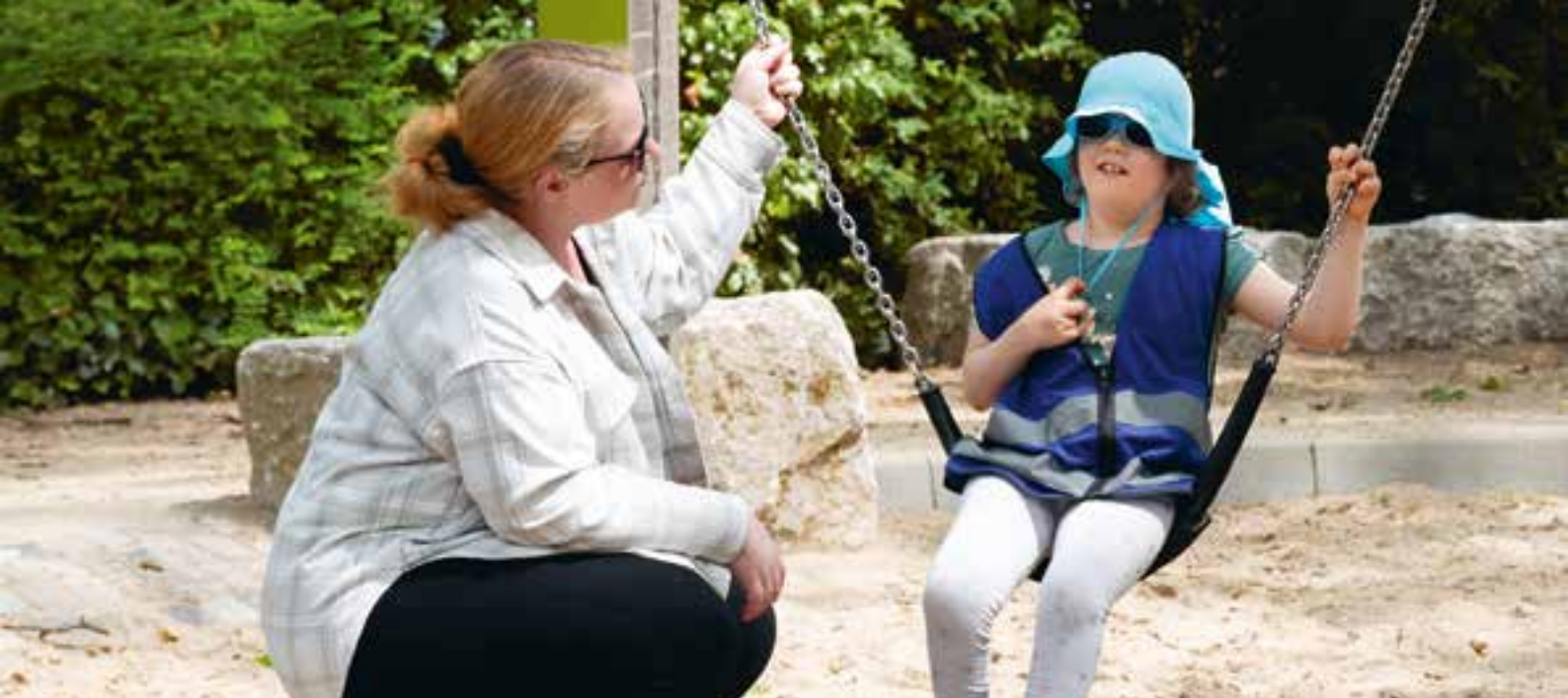
Abbildung 22: Schaukeln ist eine der beliebtesten Aktivitäten auf dem Spielplatz.

Dazu gibt es die Möglichkeit, regelmäßige Gespräche zu führen und gemeinsame Vereinbarungen zu treffen. Wir möchten die Eltern kennenlernen und ihnen die Möglichkeit geben, uns kennenzulernen. Wir legen Wert darauf, offen über unsere Arbeit zu berichten, z. B. durch Elterninformationen oder Pinnwände.