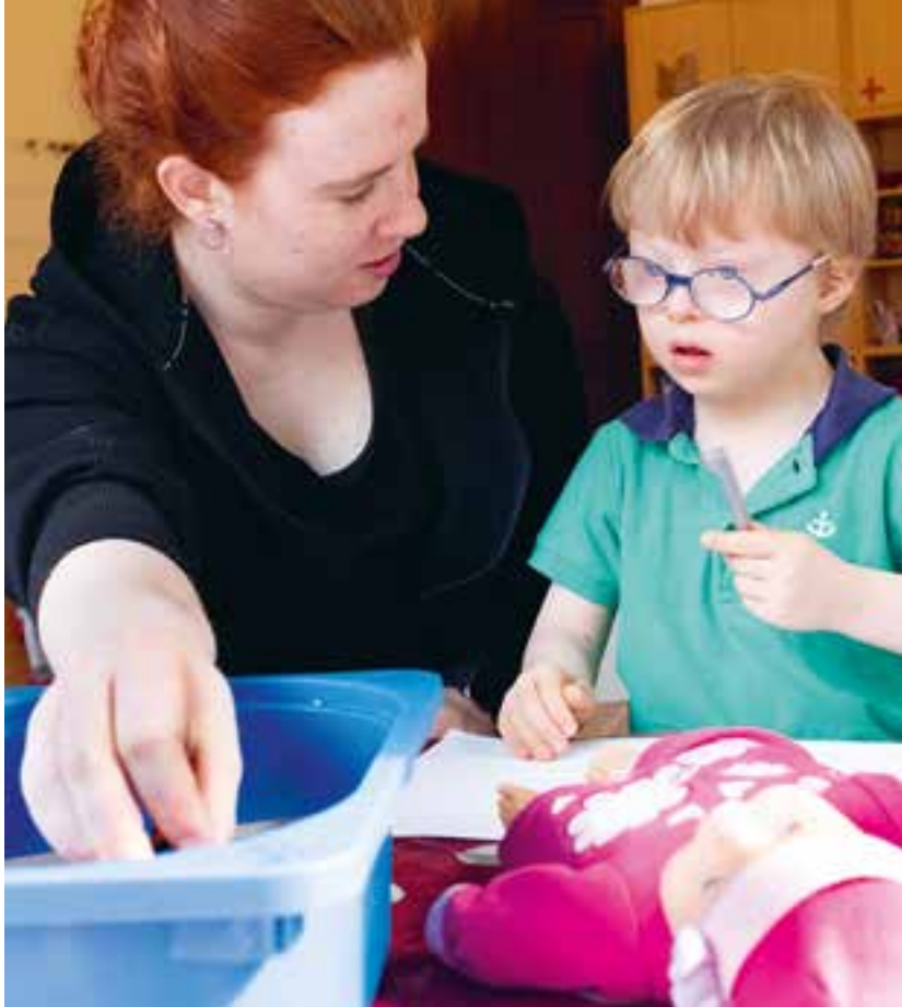
Abbildung 38: Farben lernen, Farben mischen, das ist ganz einfach.