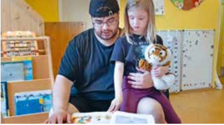
Abbildung 18+19: Gemeinsam oder alleine ein Buch anschauen macht immer Spaß.