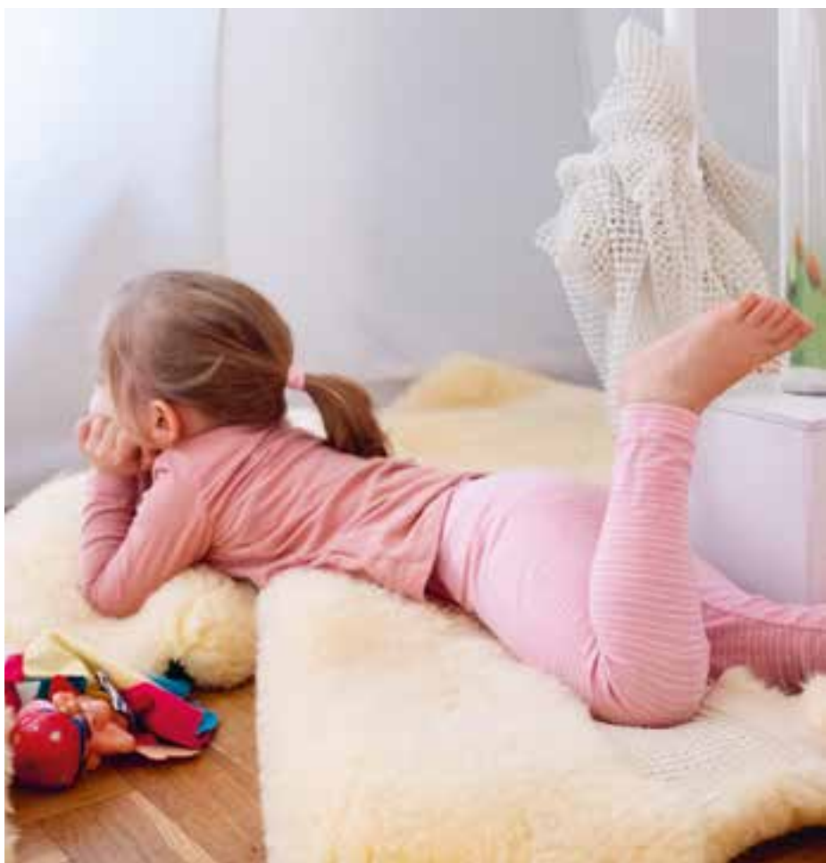
Abbildung 32: Wir schaffen Rückzugsorte für die Kinder.