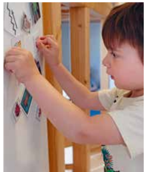
Abbildung 11: Die Magnettafel zeigt, welche Kinder auf der Hochebene sind.