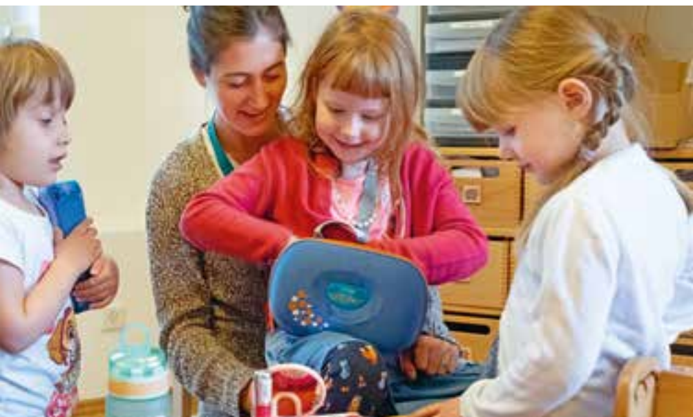
Abbildung 10: Am „Mitbringtag“: Alle sind gespannt, was aus dem Rucksack herauskommt.

Wir ermöglichen unseren „forschenden“ Kindern Zugang zu verschiedenen Materialien, damit sie je nach Interesse und Wissensstand selbstbestimmt Erfahrungen sammeln können. So können sie bereits im Vorschulalter die ersten Wenn-Dann-Beziehungen herstellen und sind damit gut für den Übergang in Kindergarten und Schule vorbereitet