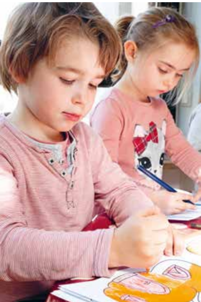
Abbildung 31: „Mit welchen Stiften wollen wir heute malen?“