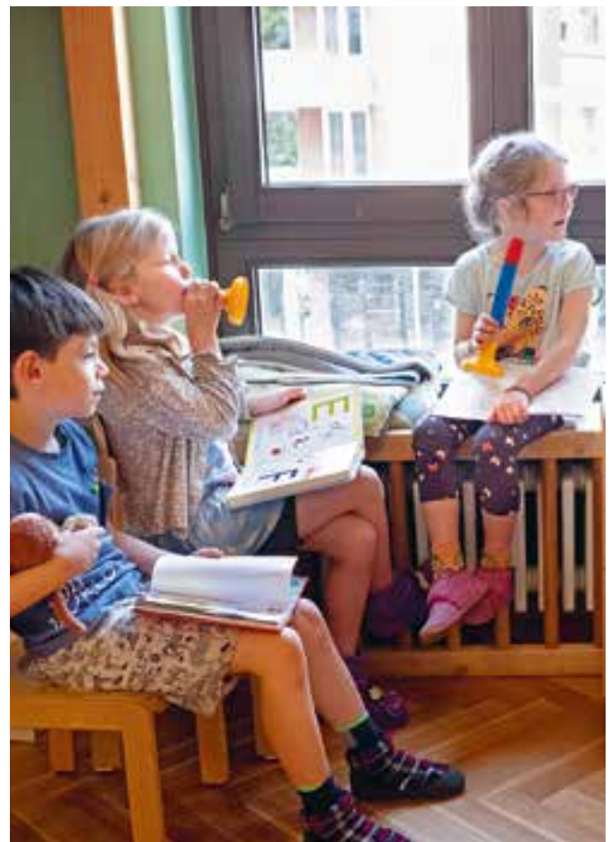
Abbildung 14: Die Murmelbahn kann auch als Flöte zusammengebaut werden...

Diese wertebasierte Erziehung bildet in den Kindern auch die Grundlage für ein Demokratieverständnis. Denn die Kinder lernen, Verantwortung für ihr Handeln zu übernehmen und sich zu beteiligen.