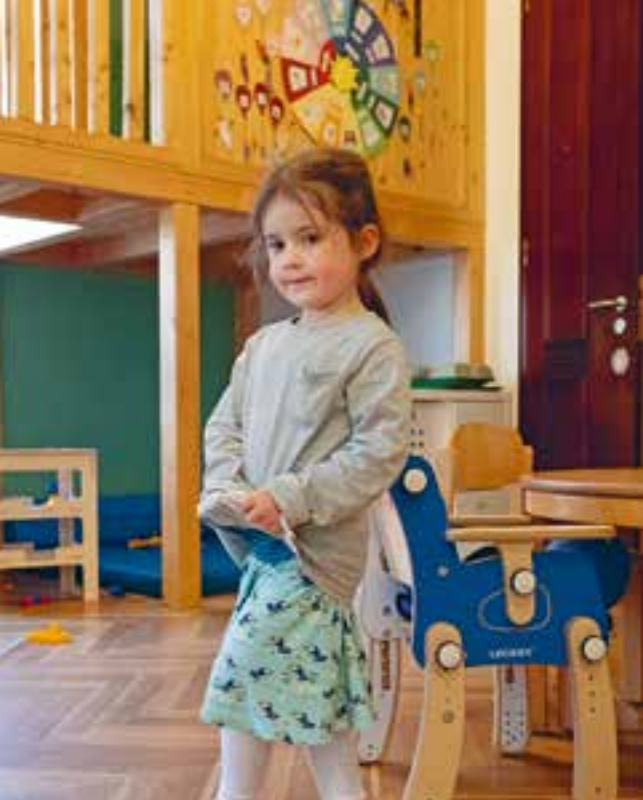
Abbildung 26: „Machen wir heute einen Ausflug?“