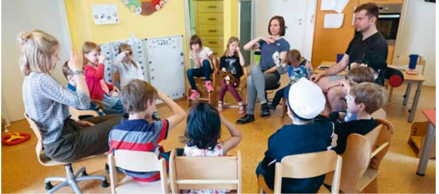
Abbildung 7: Der Morgenkreis wird mit „Lautsprachunterstützenden Gebärden“ begleitet. Hier sehen Sie die Kinder und Erwachsenen das Wort „Freitag“ gebärden.