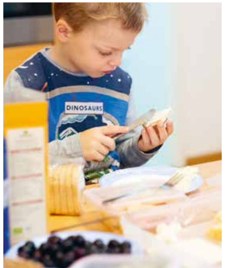
Abbildung 6: An unserem offenen Frühstück können sich die Kinder von 7:45–10:00 Uhr selbst bedienen.

Wir legen Wert auf eine ausgewogene Verpflegung. Unser Mittagessen wird von einem Caterer geliefert und ist im Schwerpunkt vegetarisch, manchmal gibt es auch Fisch. Das Frühstück und der Snack werden in der Einrichtung zubereitet.