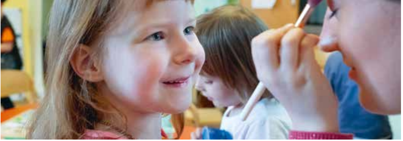
Abbildung 33: Das Schminken ist immer ein Highlight, vor allem, wenn die Kleinen mal die Großen schminken.