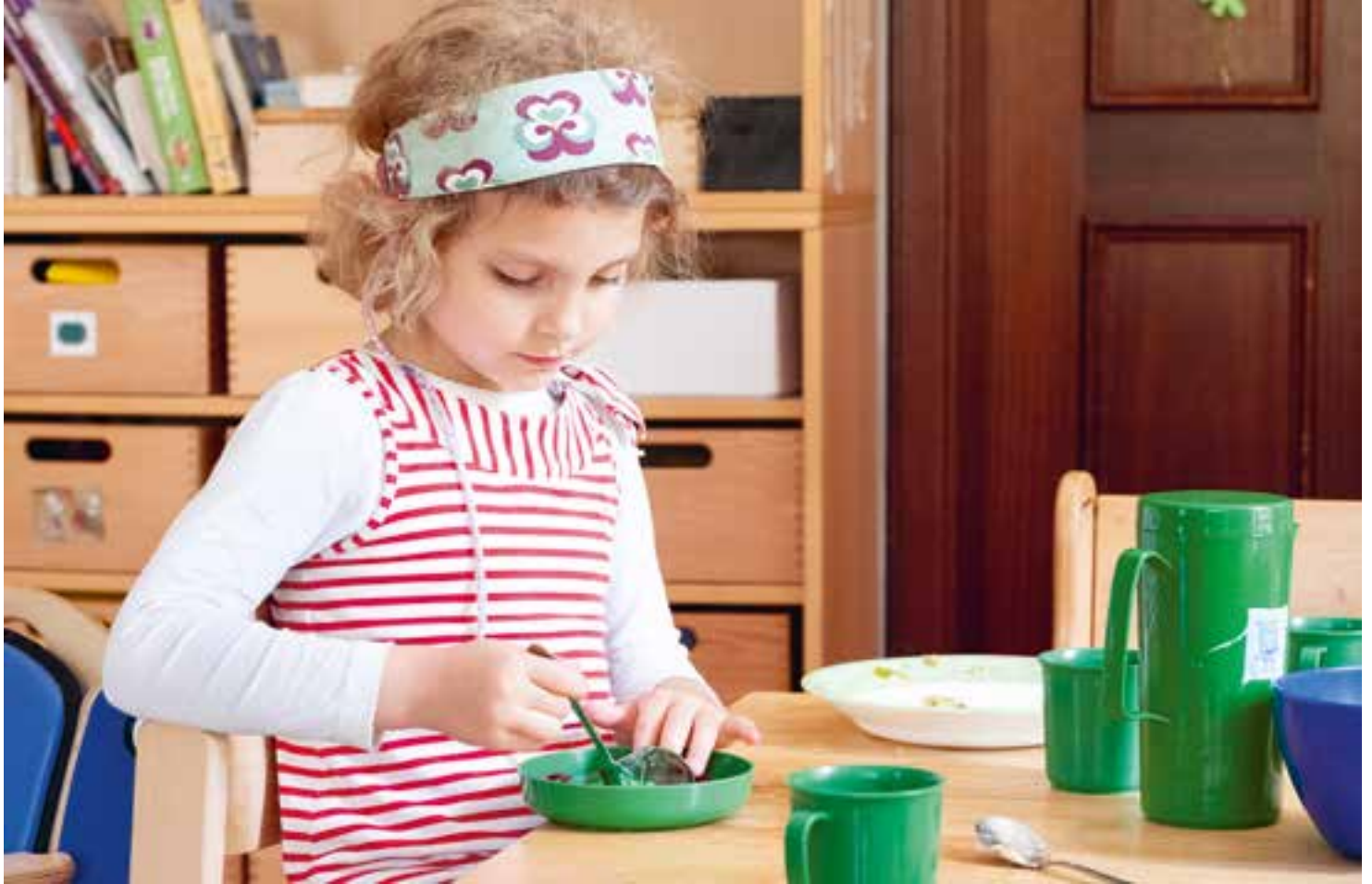
Abbildung 5: Gegen einen leckeren Wackelpudding gibt es keine Einwände, vor allem, wenn er selbst vorbereitet wurde.