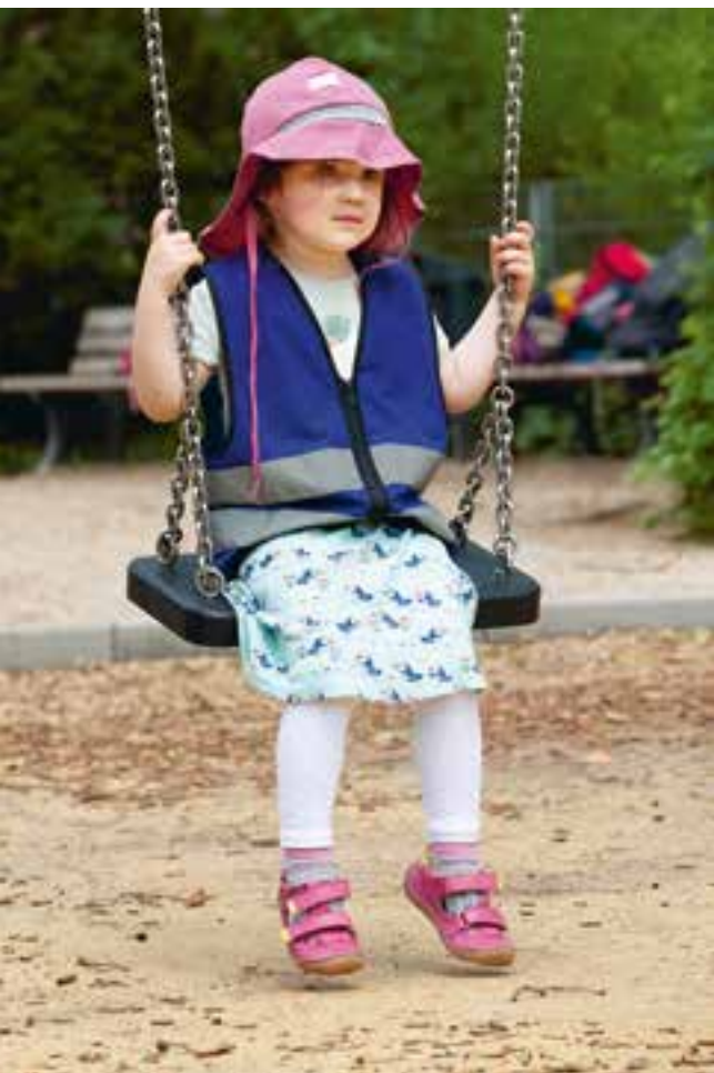
Abbildung 28: Das Spielen im Park ist ein wichtiger Bestandteil unseres Tagesablaufs.