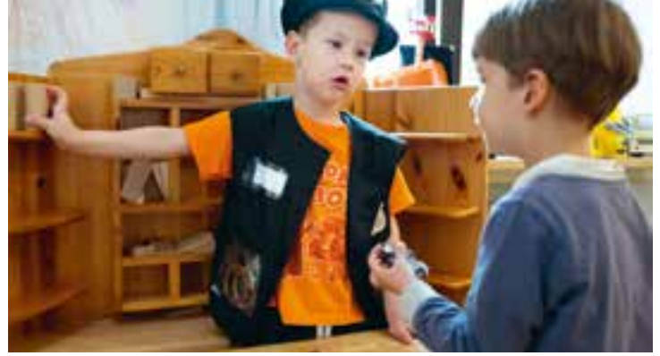
Abbildung 17: Polizist und gleichzeitig Verkäufer – na klar!

Darauf aufbauend sind die Kinder der Ausgangspunkt für die Bildung: Sie zeigen uns, für welche Themen sie sich interessieren. Kinder suchen nach neuen Erfahrungen und Erlebnissen. Darauf gehen wir ein.