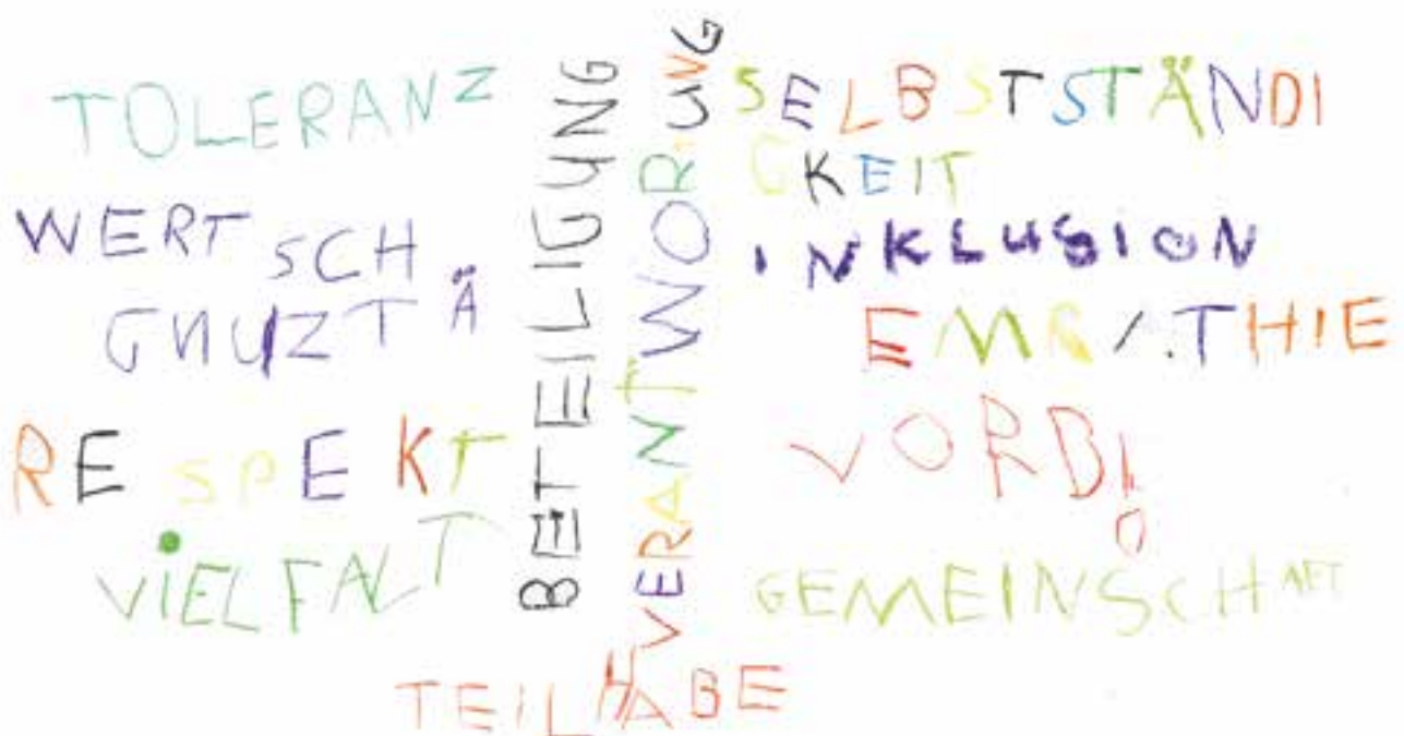
Abbildung 12: Wir leben unsere Werte mit den Kindern.

In unseren Einrichtungen sind Toleranz und Wertschätzung von Vielfalt von großer Bedeutung. Menschen anderer Kulturen, sexueller Orientierung und jeden Geschlechts, jeden Alters und mit und ohne Beeinträchtigung sind uns willkommen. Wir zeigen Respekt vor anderen Haltungen und wünschen uns Neugierde im Umgang miteinander. Die Kinder lernen bei uns, sich selbst und den Anderen so zu respektieren, wie man ist, einfühlsam zu sein und sich in eine andere Person hineinzusetzen.