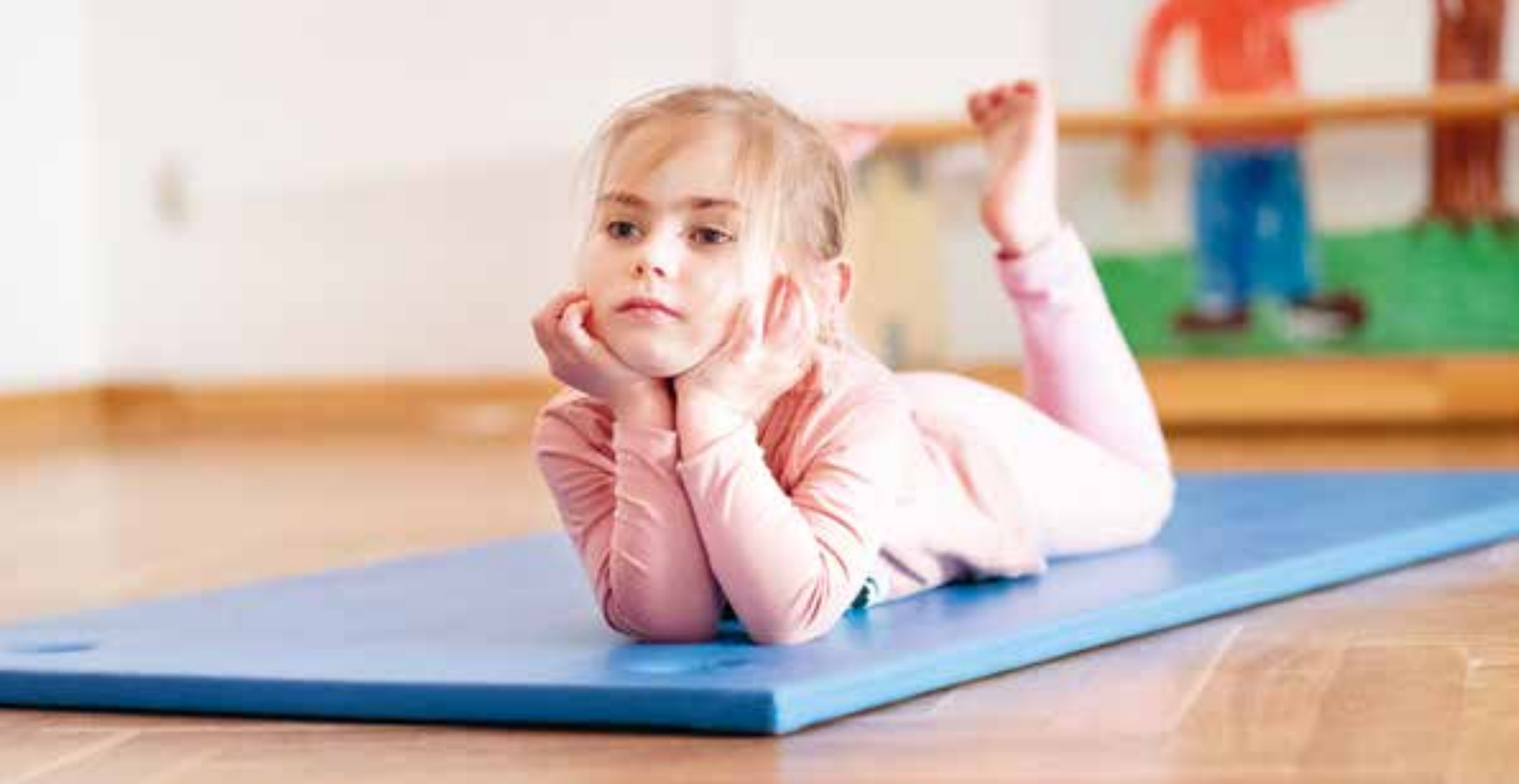
Abbildung 40: Die Ruhephase findet im Bewegungsraum statt.