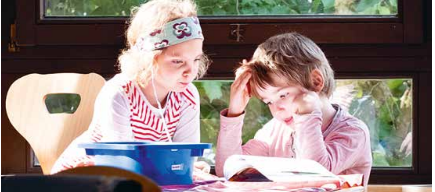
Abbildung 8: So interessant! Die beiden Kinder sitzen konzentriert am Maltisch und sehen sich gemeinsam ein Buch an.