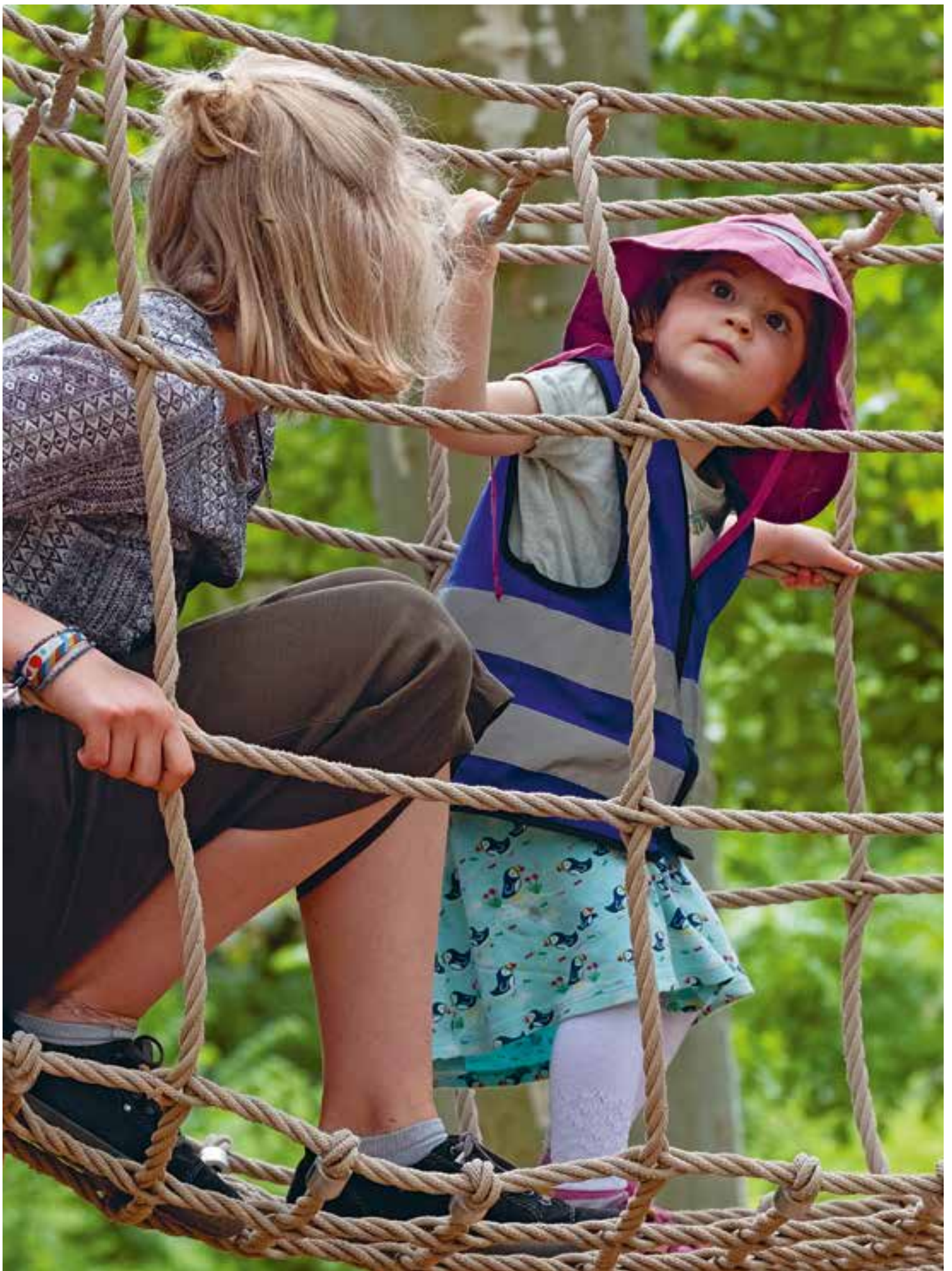
Abbildung 23: Klettergerüste sind nur etwas für Kinder!? Bei uns nicht.