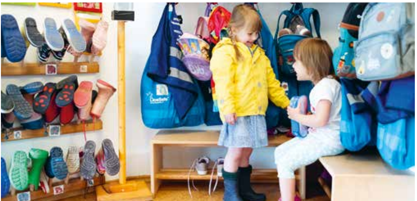
Abbildung 1: Bei uns werden Sie nicht nur von den Fachkräften begrüßt, auch die Kinder sind gerne bei der Bringzeit dabei und freuen sich auf ihre Freunde und die Eltern.