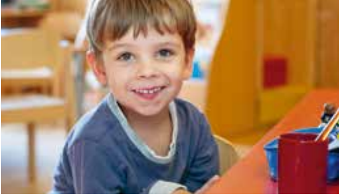
Abbildung 16: Begrüßung mit Lächeln.