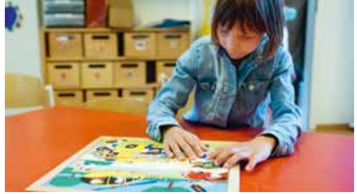
Abbildung 3+4: Beim Freispiel entscheiden die Kinder, was sie spielen möchten. Hier schminken sie sich gegenseitig und ein Kind puzzelt.