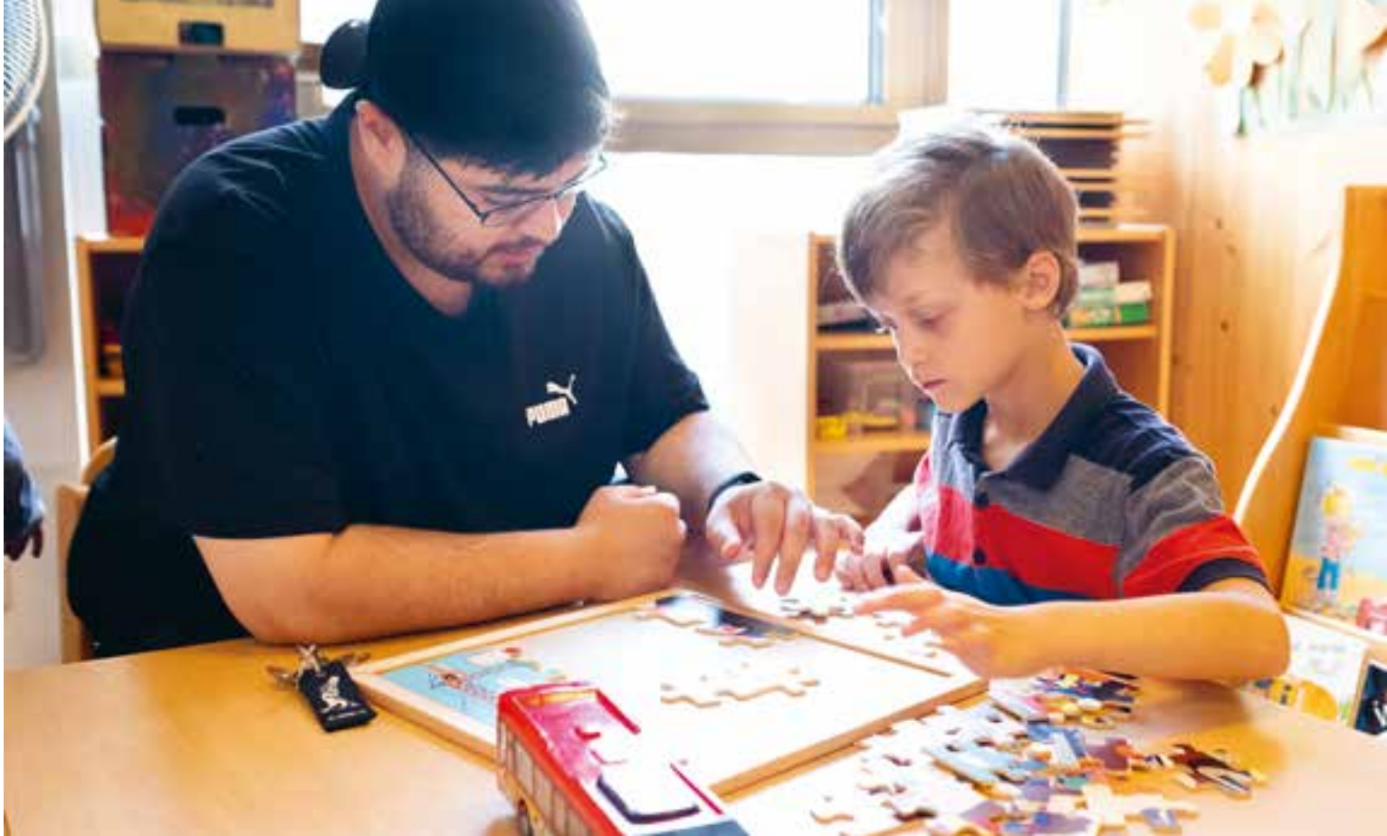
Abbildung 35: Für jedes Kind und fast jedes Interesse der Kinder ist in unserer Spielesammlung etwas dabei.