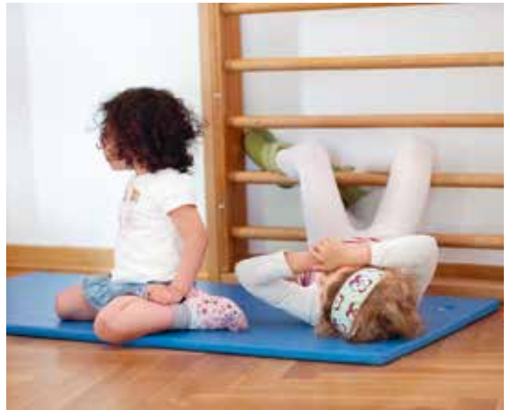
Abbildung 2: Die Kletterwand kann auch zum Füße hochlegen genutzt werden.

Der Bewegungsraum ist nicht nur zum Turnen da: hier können wir uns ausruhen, gemeinsam frühstücken oder Rollenspiele spielen.