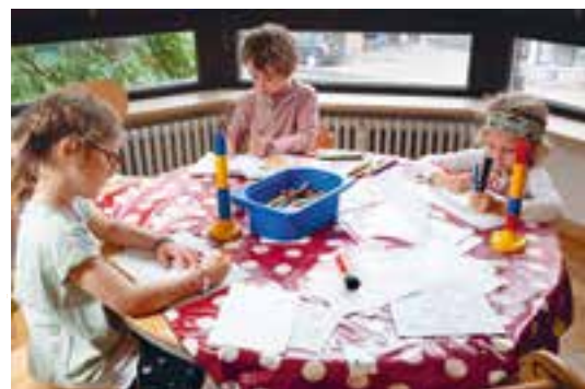
Abbildung 9: Hier wird noch etwas für das Rollenspiel „Orchester“ gemalt.

Gemeinsames Singen und Musizieren fördert nicht nur das soziale Lernen und die Kontaktfähigkeit, sondern wirkt sich zudem auch positiv auf die Sprachentwicklung der Kinder aus. Die kindliche Freude daran, Töne zu produzieren und zu entdecken, kann in gemeinsamen Musik- und Singkreisen gut aufgegriffen werden.