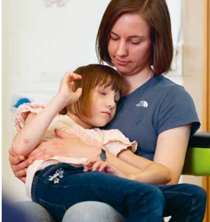
Abbildung 37: Eine gute Bindung zu den Kindern aufzubauen, liegt uns am Herzen.