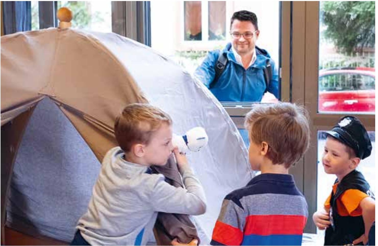
Abbildung 30: Beim Abgeben schmeißen die Kinder ihre Eltern raus.