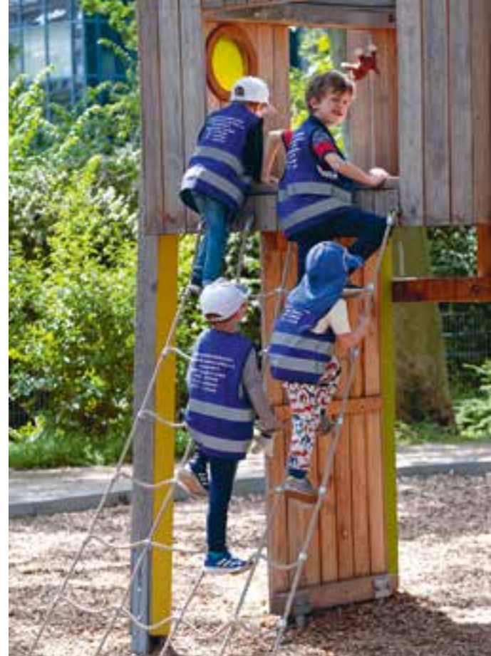
Abbildung 39: Auf die Plätze. Fertig? Und los! Wer zuerst auf dem Klettergerüst ist?