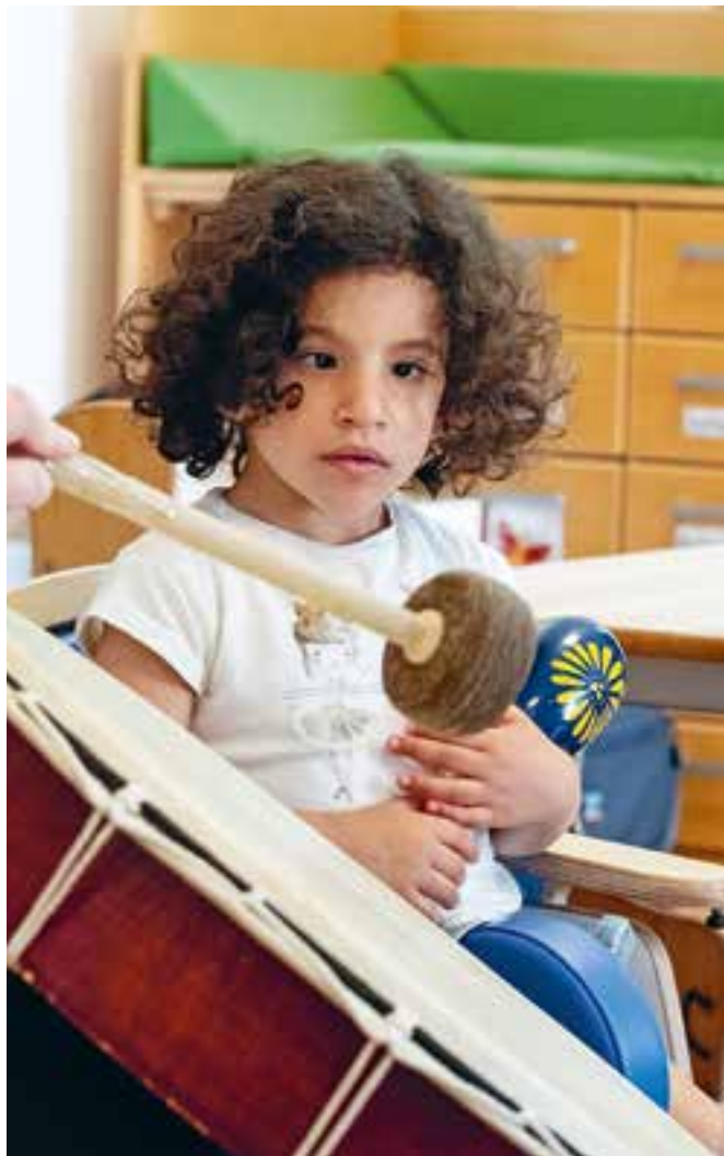
Abbildung 24: In diesen Rhythmus der Trommel kann ich gleich einsteigen!

Eine Besonderheit unseres Kinderladens ist, dass wir eine sehr kleine, fast familiäre, Einrichtung zentral in der Stadt Frankfurt sind. So können wir unsere Arbeit ganz persönlich gestalten: Den Mitarbeiter*innen ist jedes einzelne Kind wichtig, das bedeutet „das KIND“ steht im Mittelpunkt, unabhängig davon, ob es körperlich oder geistig beeinträchtigt ist, ob es einer anderen Kultur oder Religion angehört oder welche Eigenschaften es mitbringt. Wir arbeiten stark familienergänzend.