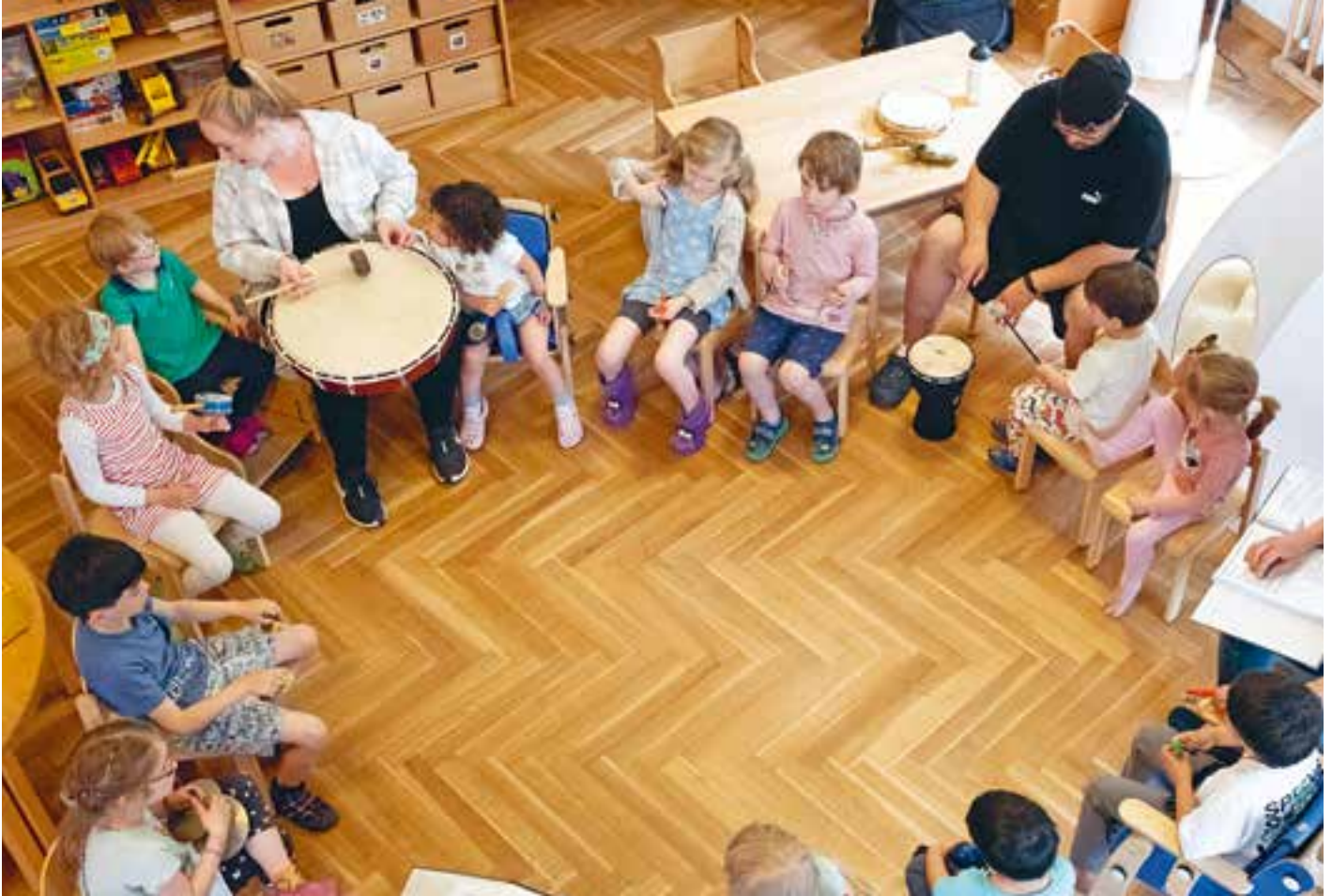
Abbildung 13: Es ist laut und bunt, wenn im Singkreis alle trommeln, klingeln oder rasseln.