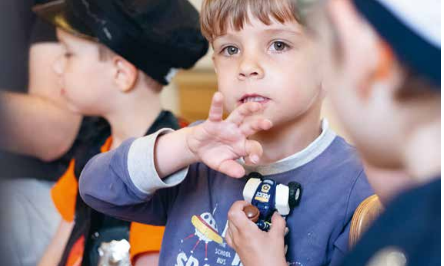
Abbildung 34: Gemeinschaft ist uns wichtig. Im Morgenkreis schauen die Kinder neugierig auf die mitgebrachten Spielzeuge.