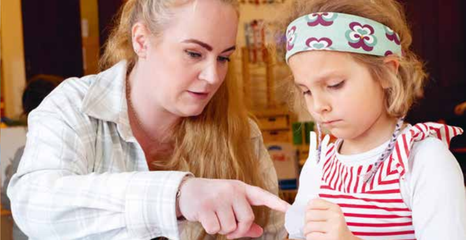
Abbildung 41: Wir sprechen aus, was passiert und unterstützen so die Kinder in ihrer Entwicklung.