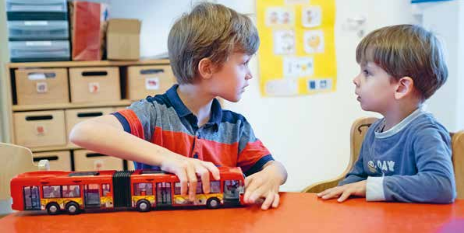
Abbildung 25: „Möchtest du mit mir spielen?“