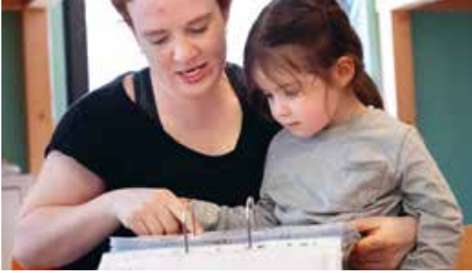
Abbildung 20: „Welche Gebärden gehören zu diesem Lied?“