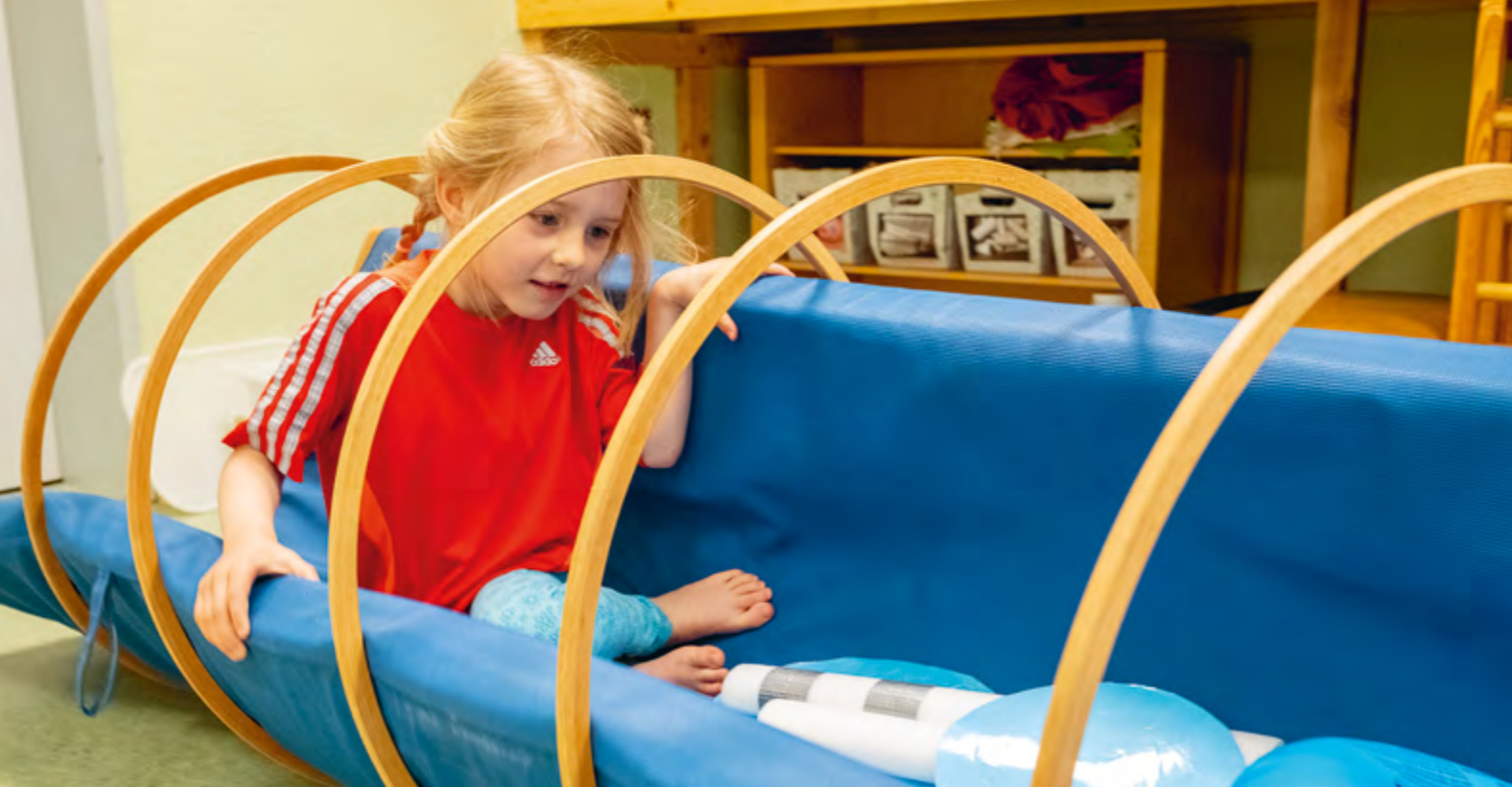
Abbildung 40: Gut festhalten – denn nun begibt sich das selbstgebaute Schiff auf die weite See!