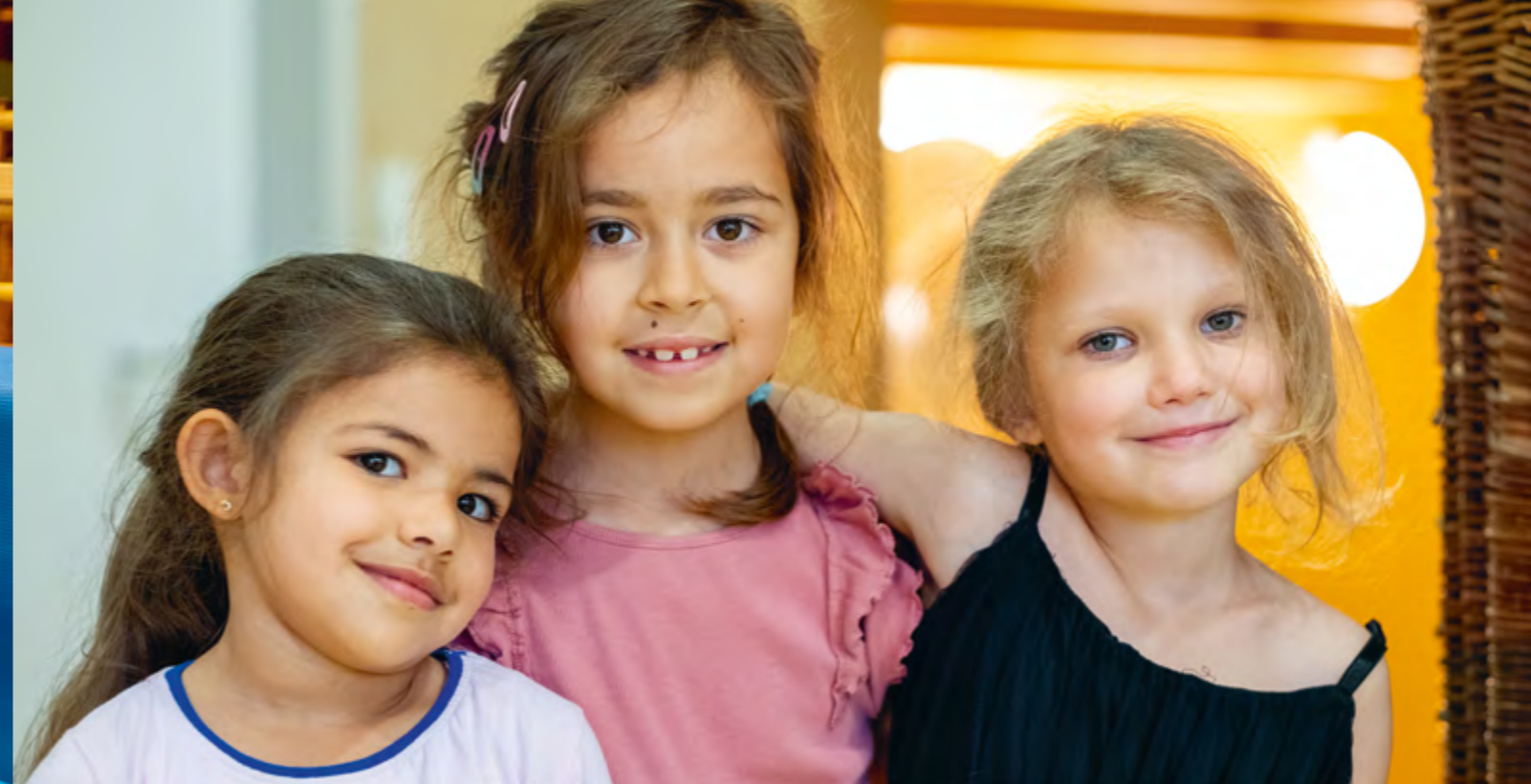
Abbildung 41: Manch ein Freundschaftsband bildet sich im Kindergarten und hält bis ins Alter.