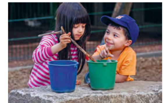
Abbildung 8: „Schau her, ich habe dir eine Suppe aus Blättern gekocht.“

Gemeinsames Singen und Musizieren fördert nicht nur das soziale Lernen und die Kontaktfähigkeit, sondern wirkt sich zudem auch positiv auf die Sprachentwicklung der Kinder aus. Die kindliche Freude daran, Töne zu produzieren und zu entdecken, kann in gemeinsamen Musik- und Singkreisen gut aufgegriffen werden.