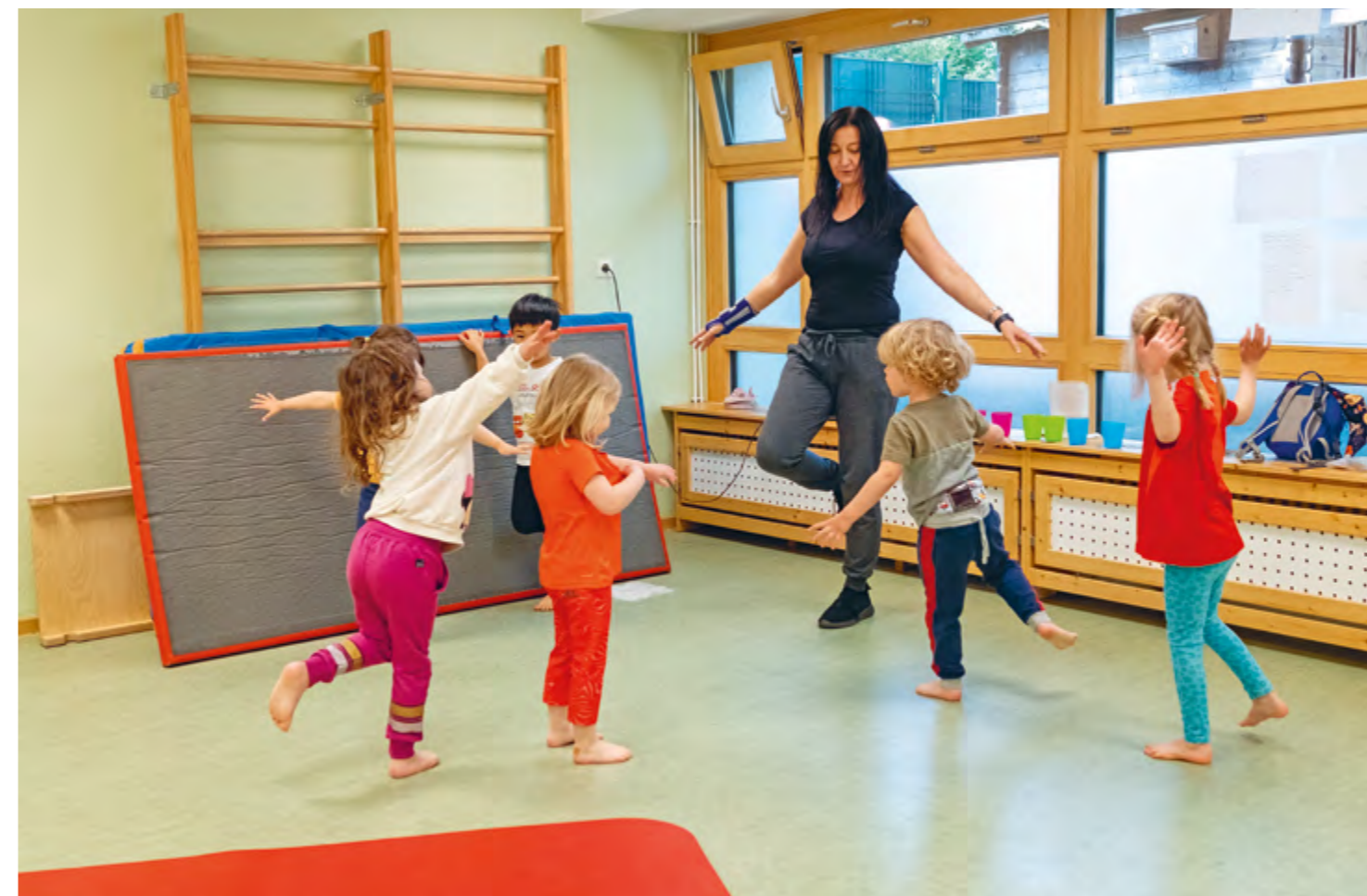
Abbildung 27-29: Wir legen viel Wert darauf, dass die Kinder sich bei unseren Mitarbeiter*innen sicher, wohl und unterstützt fühlen, um sich bestmöglich entwickeln zu können. Die Bindung zwischen Kind und Mitarbeiter*in ist die Basis für die Fortschritte, die Kinder im Kindergarten machen.