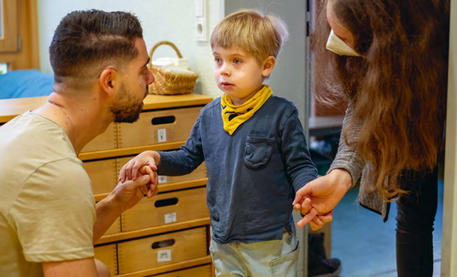
Abbildung 34: Auf Augenhöhe und in guter Verbindung zu sein: Das schätzen Kinder ebenso wie ihre Eltern und unsere Kooperationspartner*innen.