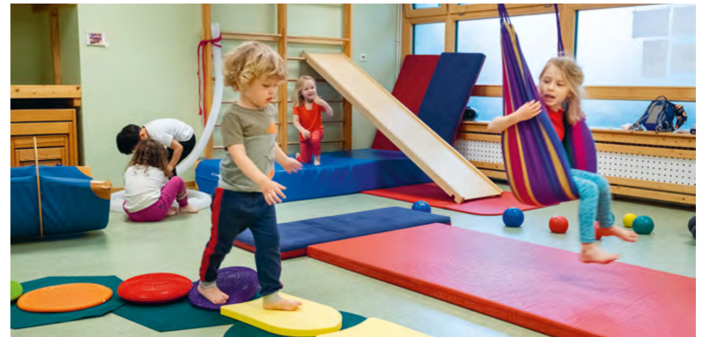
Abbildung 1: „Ich bleibe auf meinem Weg“: Wir unterstützen jede*n so, wie er oder sie kann und möchte!