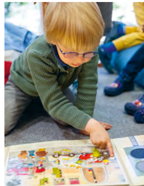
Abbildung 10: Bilderbücher helfen Kindern dabei, ihre Umwelt zu entdecken und zu verstehen.