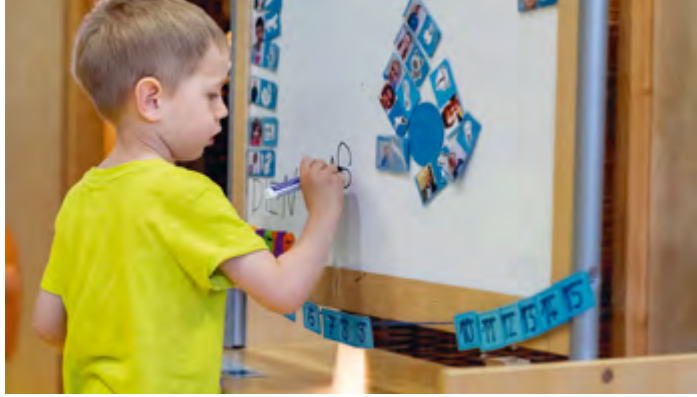
Abbildung 15: „Ich schaffe das schon ganz alleine.“

Darauf aufbauend sind die Kinder der Ausgangspunkt für die Bildung: Sie zeigen uns, für welche Themen sie sich interessieren. Kinder suchen nach neuen Erfahrungen und Erlebnissen. Darauf gehen wir ein.