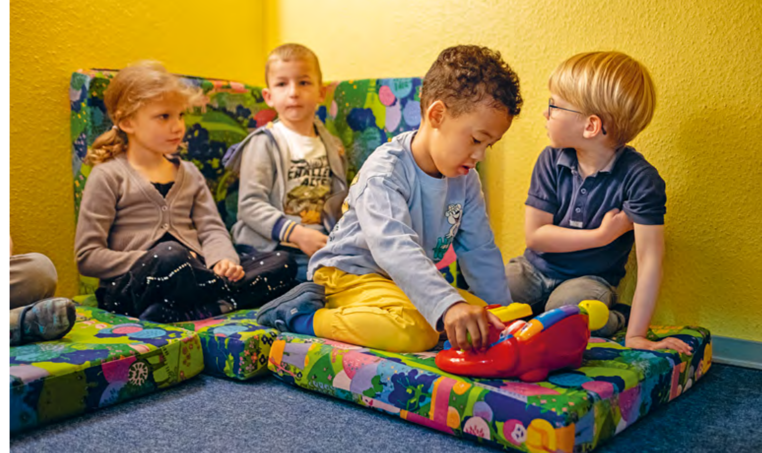
Abbildung 35: Die Kinder finden bei uns einen sicheren Rahmen vor. Wir hören den Kindern zu und nehmen sie in ihren Worten ernst.