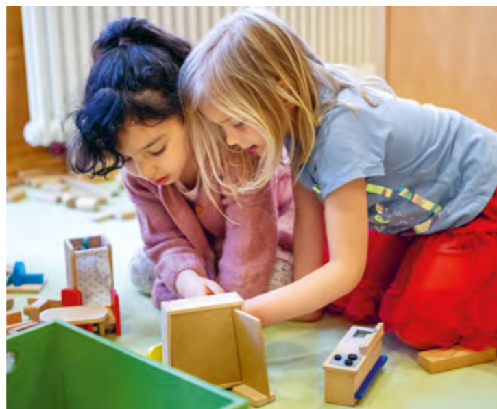
Abbildung 2: „Du bist der Vater und ich bin das Kind“. Über Rollenspiele wird Erlebtes verarbeitet.

In der Gruppe üben die Kinder, wie Gemeinschaft funktioniert.