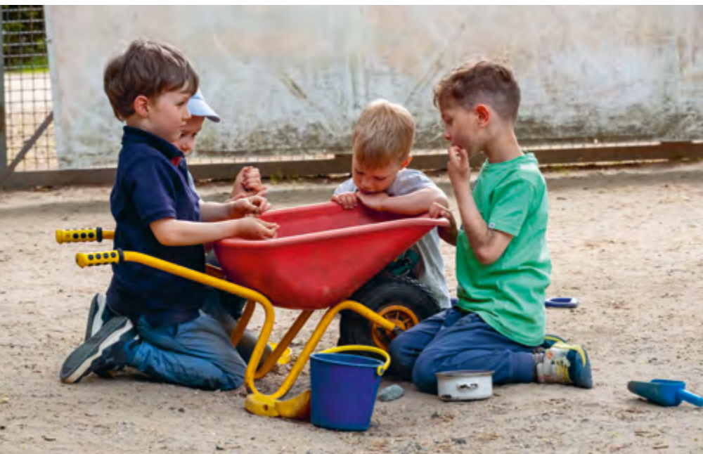
Abbildung 9: „Na nu? Was krabbelt denn da?“ – In unserer täglichen Gartenzeit gibt es lauter Möglichkeiten, die Natur zu entdecken!

In unseren Einrichtungen sind Toleranz und Wertschätzung von Vielfalt von großer Bedeutung. Menschen anderer Kulturen, sexueller Orientierung und jeden Geschlechts, jeden Alters und mit und ohne Beeinträchtigung sind uns willkommen. Wir zeigen Respekt vor anderen Haltungen und wünschen uns Neugierde im Umgang miteinander. Die Kinder lernen bei uns, sich selbst und den Anderen so zu respektieren, wie man ist, einfühlsam zu sein und sich in eine andere Person hineinzusetzen.