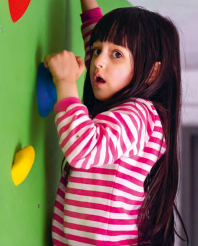
Abbildung 25: Die Kinder lieben unsere Kletterwand!