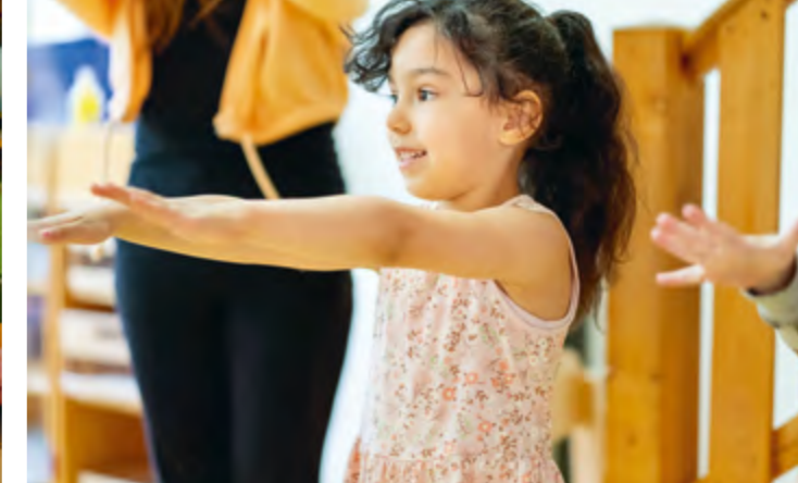
Abbildung 33: Körperspannung und Konzentration: das Mädchen ist beim Tanzen ganz in ihrem Element.