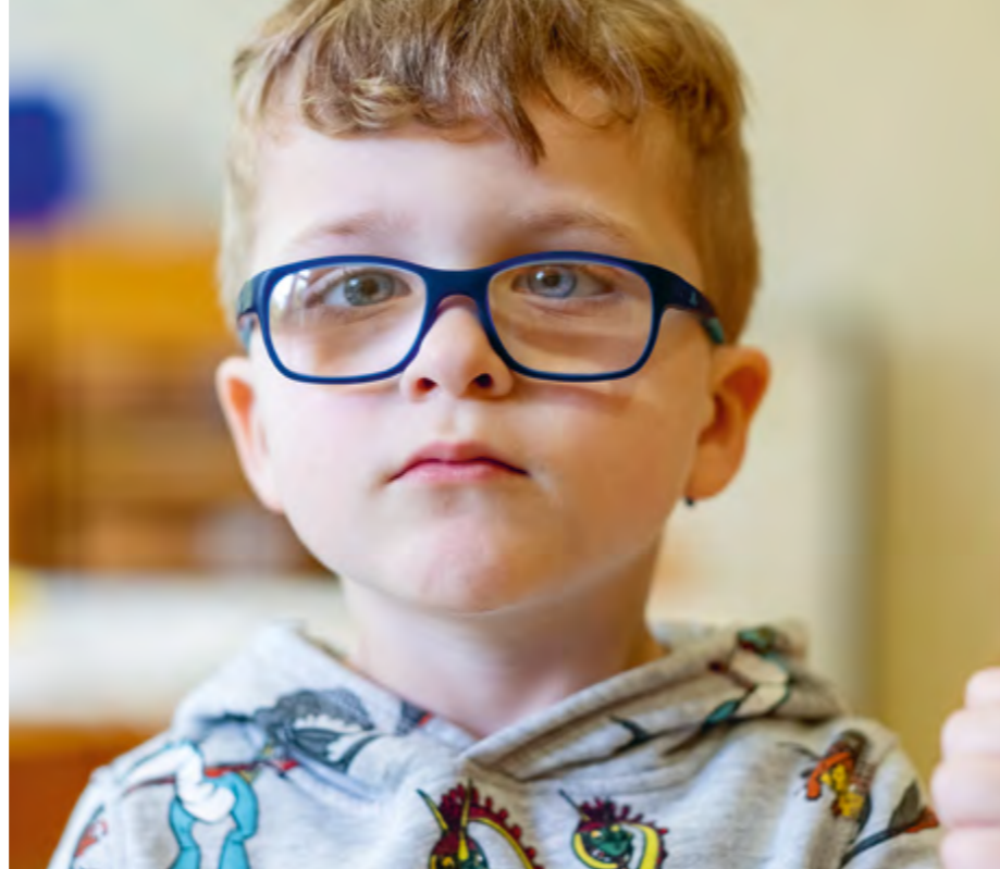
Abbildung 26: Kinder zeigen große Neugierde bei allem, was um sie herum passiert.