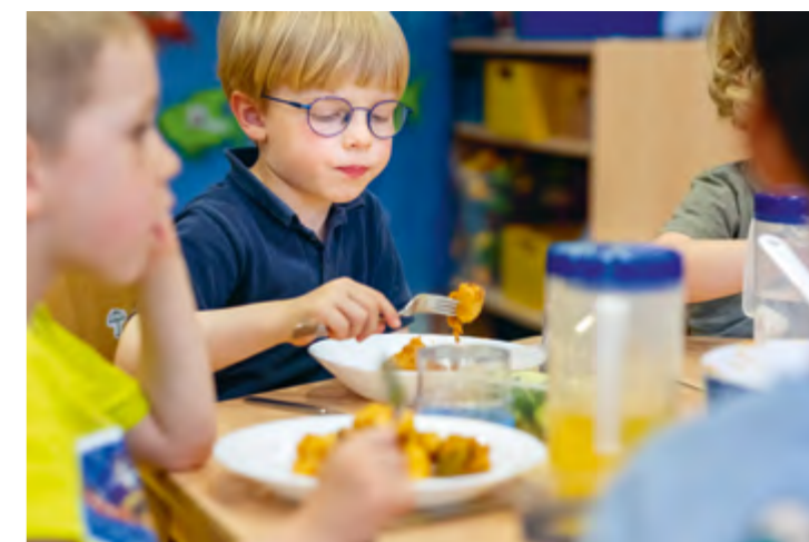
Abbildung 5: Selbstbestimmung lernen: Die Kinder füllen am Mittagstisch selbst ihren Teller.

Wir legen Wert auf eine ausgewogene Verpflegung. Unser Mittagessen wird von einem Caterer geliefert und ist im Schwerpunkt vegetarisch, manchmal gibt es auch Fisch. Das Frühstück und der Snack werden in der Einrichtung zubereitet.