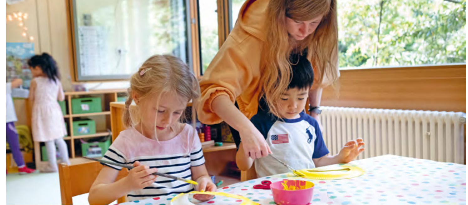
Abbildung 7: Papier, Stifte, Pinsel, Farben, Schere und den Kopf voller Ideen – mehr brauchen Kinder nicht, um sich malerisch die Welt zu erschließen.