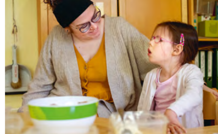
Abbildung 32: Auf Augenhöhe begegnen - so versuchen wir den Kindern Sicherheit zu geben.