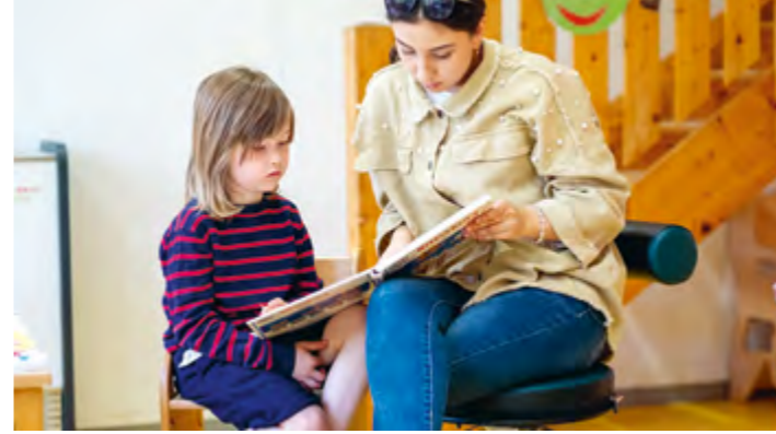
Abbildung 17: Schon bald steht meine Einschulung an! Wir begleiten auf dem Weg dorthin.

Beobachtung ist eine Grundlage unserer pädagogischen Tätigkeit. Dadurch erfahren wir viel über die Interessen und die Entwicklung der Kinder. Wir dokumentieren unsere Beobachtungen und tauschen uns darüber aus. So können wir gezielt auf die Bedürfnisse der Kinder eingehen und das pädagogische Handeln planen und reflektieren. Die Bildungs- und Erziehungsziele können auf diese Weise konkret verfolgt werden. Unsere Mitarbeiter*innen befinden sich in einem ständig laufenden Prozess, ihre pädagogischen Tätigkeiten zu reflektieren. Im Team erhalten sie auch Feedback von ihren Kolleg*innen.