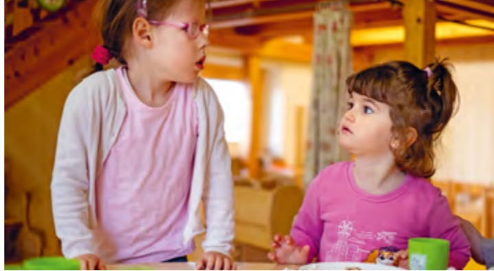
Abbildung 20: ...oder am Mittagstisch.