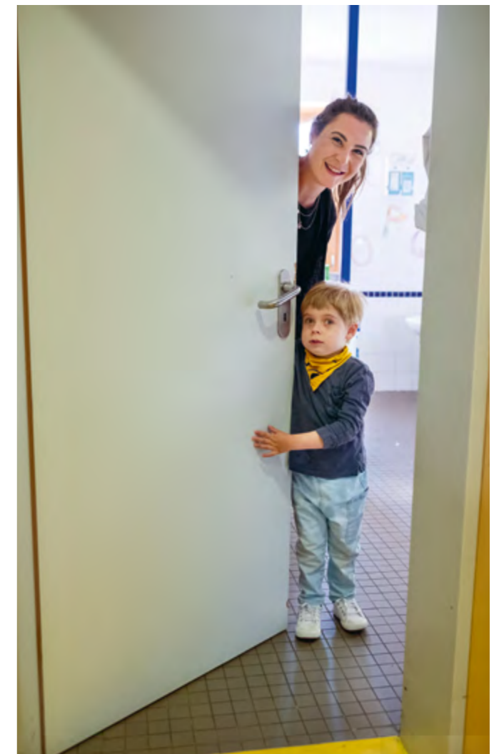
Abbildung 23: Kuckuck! Integriert in jede Gruppe ist ein Kinderbad.