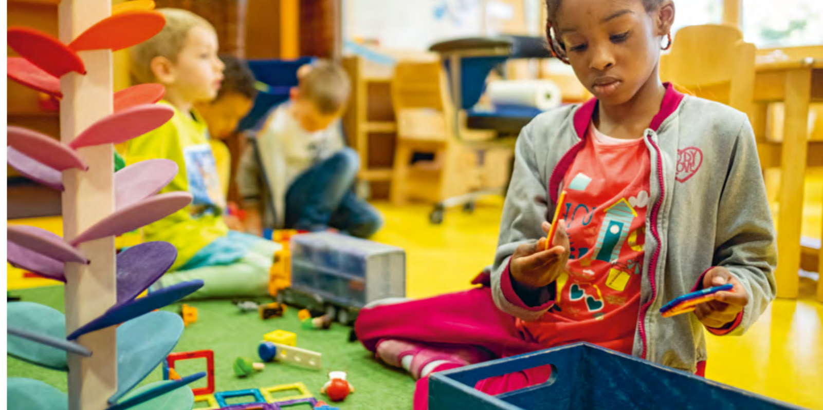
Abbildung 24: Die Kinder können selbst entscheiden, mit wem und womit sie sich beschäftigen.

Unser Tagesablauf ist strukturiert und bietet den Kindern Orientierung. Er basiert auf folgenden zentralen Elementen: