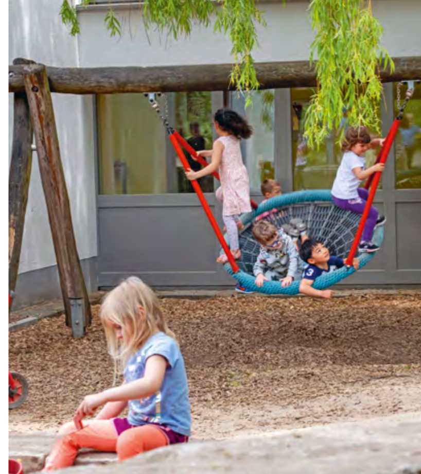
Abbildung 38: Unsere Nestschaukel ist besonders beliebt bei den Kindern!