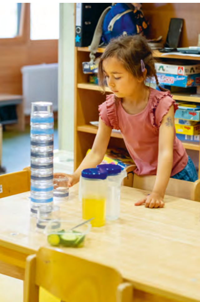
Abbildung 30: Die Kinder decken den Frühstückstisch.