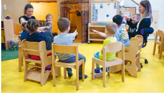
Abbildung 19: Bei uns beginnt Partizipation am frühen Morgen – im Morgenkreis ...