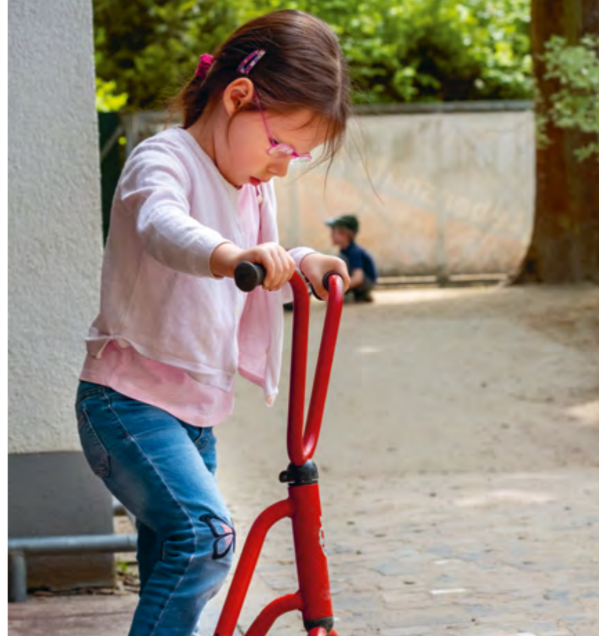
Abbildung 36-37: Ob Lesen in der Ruheecke oder Rädchen fahren im Garten - die Kinder finden immer eine Beschäftigung, die sie begeistert.