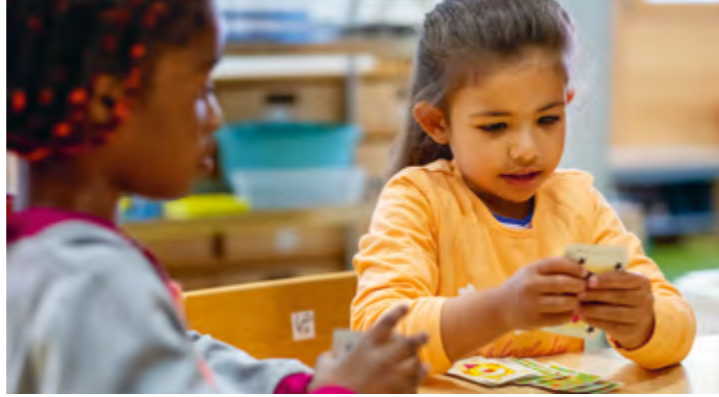
Abbildung 16: In der Freispielzeit können die Kinder selbst auswählen, wie sie diese gestalten möchten.

Die Förderung der Selbstständigkeit beginnt bereits beim Frühstück. Die Kinder dürfen eigenständig den Essenswagen holen und tragen Sorge dafür, dass alle Utensilien vorhanden sind. Gemeinsam schauen wir nach, ob genügend Teller vorhanden und die Wasserkaraffen ausreichend gefüllt sind.