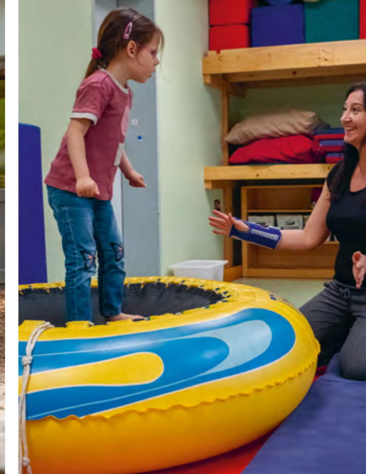
Abbildung 39: In die Höhe zu springen erfordert Mut. Wir geben Hilfestellung.