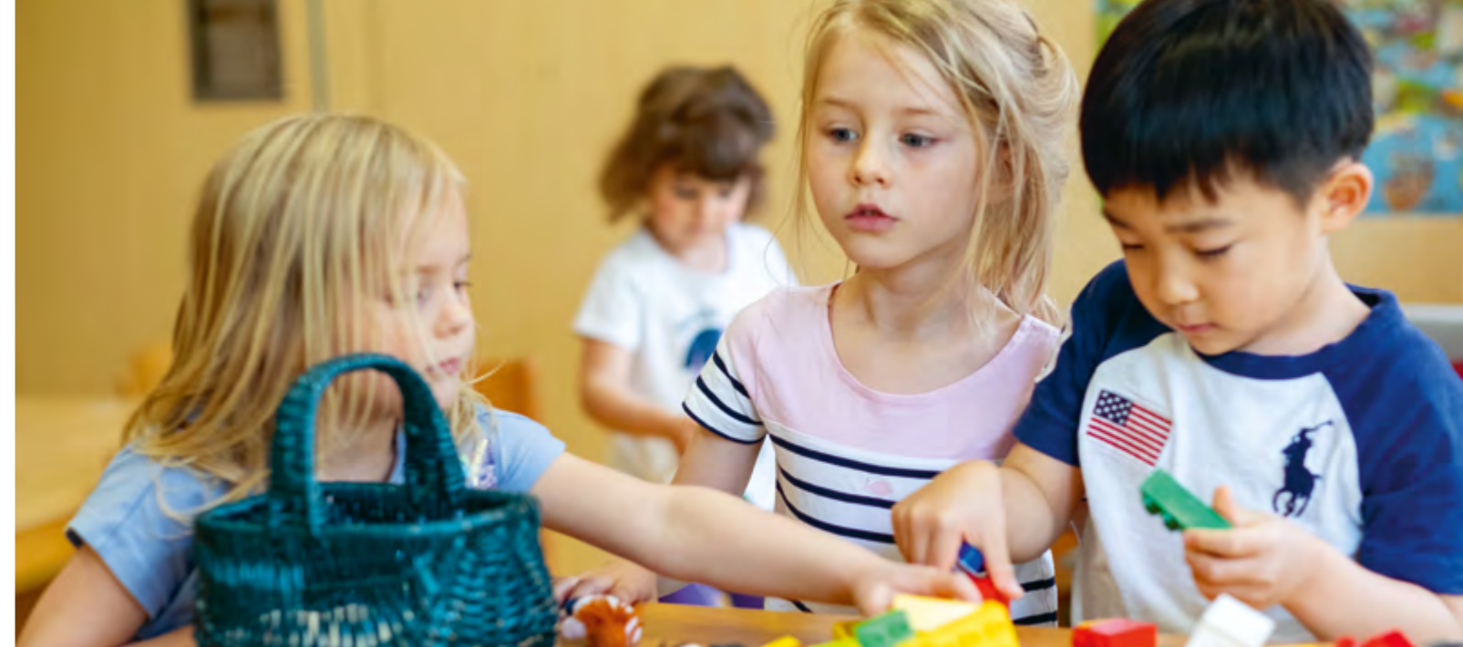
Abbildung 21: Stein auf Stein - Nicht immer entsprechen meine Wünsche und Vorstellungen denen meiner Mitmenschen. Diese Erfahrung ist wichtig, um Rücksicht, Kompromissbereitschaft und ein soziales Miteinander zu erlernen.

Besonders wichtig ist uns eine gute und vertrauensvolle Zusammenarbeit mit den Eltern [Bildungs- und Erziehungspartnerschaft]. Die Eltern sind die wichtigsten Bezugspersonen für die Kinder. Daher sehen wir sie als die Expert*innen für ihre Kinder. Die Betreuung der Kinder basiert auf dem Vertrauen zwischen Eltern und Mitarbeiter*innen. Wir wünschen uns deswegen einen Dialog auf Augenhöhe miteinander, um die Kinder adäquat begleiten zu können. Gemeinsam können wir den Kindern eine möglichst gute Entwicklung ermöglichen.