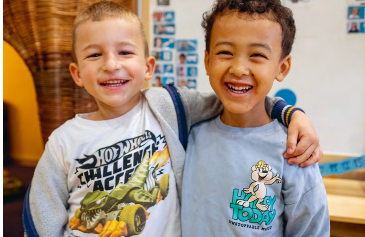
Abbildung 4: Gemeinsam sind wir stark! - Kinderfreundschaften nehmen im Kindergartenalltag eine große Bedeutung ein.

Wir möchten, dass die Kinder so selbständig wie möglich sind und werden. Damit sie so eigenständig wie möglich handeln können, üben die Kinder in unseren Einrichtungen die sogenannte „Lebenspraxis“. Dazu gehört zum Beispiel das möglichst selbständige Essen und das möglichst selbständige An- und Ausziehen. So bemerken sie auch, was sie schon können. In den Kindern entsteht dadurch Selbstbewusstsein. Das erleichtert es ihnen, einen eigenen Standpunkt zu vertreten und innerlich selbständig zu werden.