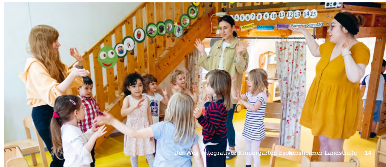
Abbildung 14: Singen und Tanzen macht glücklich – und unterstützt durch Gebärden jeden Einzelnen.

Wir leben einen geregelten Tagesablauf, bei dem die Kinder Stabilität erfahren und sich so auf neue Bildungsprozesse gut einlassen können.