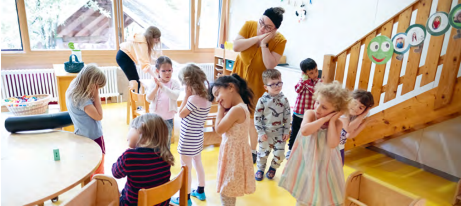
Abbildung 6: „Häschen in der Grube, saß und schlief.“ Gemeinsam üben wir mit den Kindern verschiedene Gebärden.