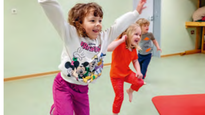
Abbildung 3: „Es ist normal, verschieden zu sein“ – Bei uns stehen Individualität und Vielfalt ganz oben.

Jedes Kind, das in einer unserer Integrativen Kindereinrichtungen betreut wird, hat bereits viele Erfahrungen in verschiedensten Bereichen gesammelt [Basiskompetenzen]. Wir unterstützen die Kinder dabei, ihre Erfahrungen zu erweitern und Fähigkeiten zu erwerben. So werden die Kinder für das Leben stark. Dabei fördern wir zum einen individuelle Kompetenzen des Kindes, wie zum Beispiel Problemlösen oder das Selbstwertgefühl [Individuumsbezogene Kompetenzen]. Zum anderen sind die Kinder in unseren Einrichtungen mit anderen Menschen zusammen und wir stärken sie darin, empathisch, kommunikativ und kooperativ zu sein [Kompetenz zum Handeln im sozialen Kontext]. Dabei möchten wir den Kindern auch Kreativität und Werte des sozialen Miteinanders vermitteln. So werden die Kinder stark, um Veränderungen und Belastungen erfolgreich zu bewältigen und schwierige Situationen als Herausforderung zu begreifen [Resilienz].