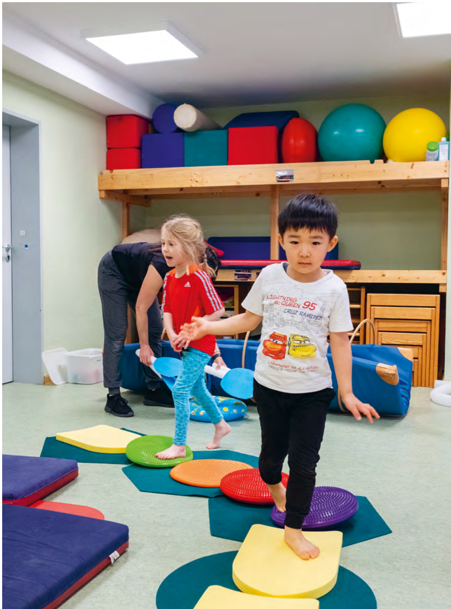
Abbildung 22: Auf den Fühlsteinen können die Kinder sich ausprobieren.

Unsere Gruppenräume mit jeweils angrenzendem Sanitärbereich werden individuell gestaltet und können sich immer wieder verändern, um auf besondere Bedürfnisse der Kinder einzugehen und ihnen neue Spielanreize zu geben.