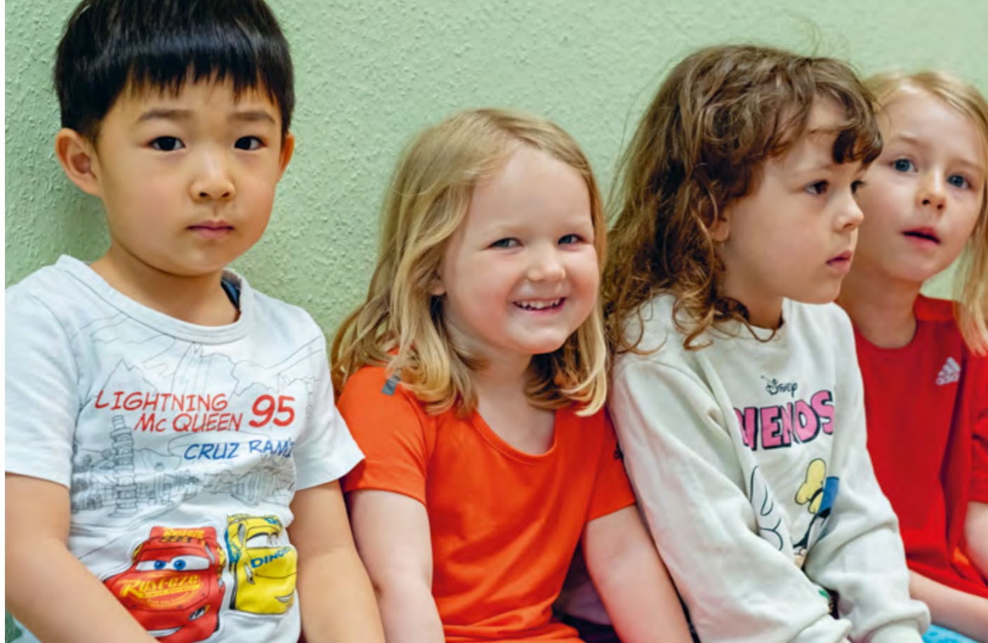
Abbildung 12: Gemeinsam und füreinander kommt man auch zum Ziel. Und das mit einem viel besseren Gefühl im Bauch – mit einem Gefühl von Verbundenheit....