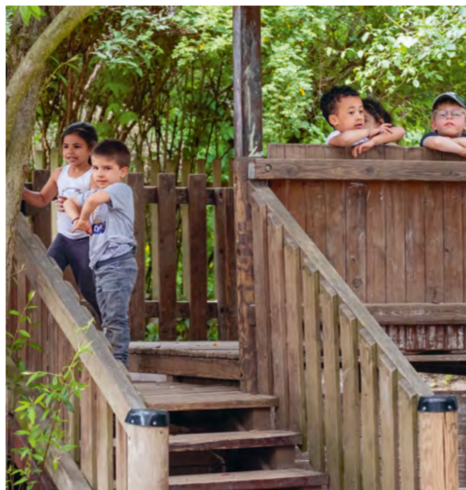
Abbildung 31: Auf unserem Gartengerüst ist genug Platz für Alle! Von dort haben die Kinder eine tolle Aussicht über den gesamten Gartenbereich.